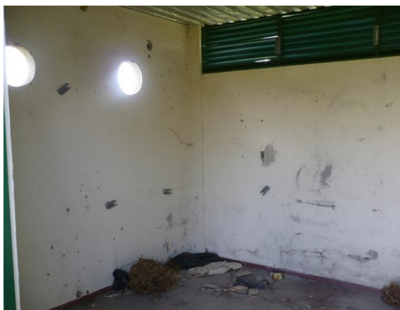
Salón de Equipos