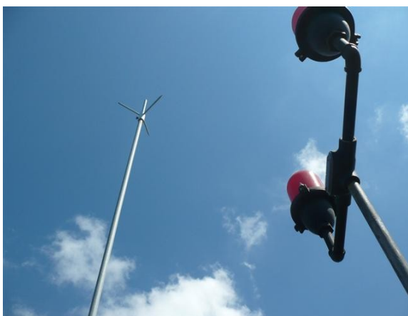
Luces de Obstrucción y Pararrayos