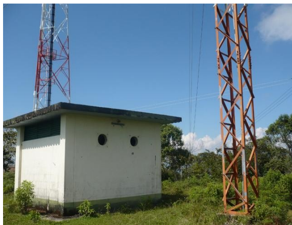
Vista posterior Caseta