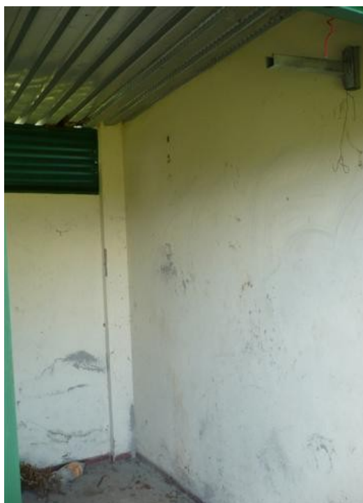
Salón de Equipos (1)