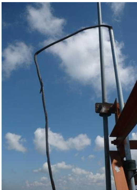
Guaya de Pararrayos