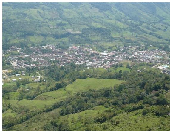
Vista de Oiba desde la Estación