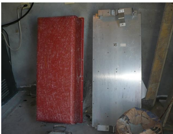
Antenas VHF en Cuarto de Radio Comunitaria