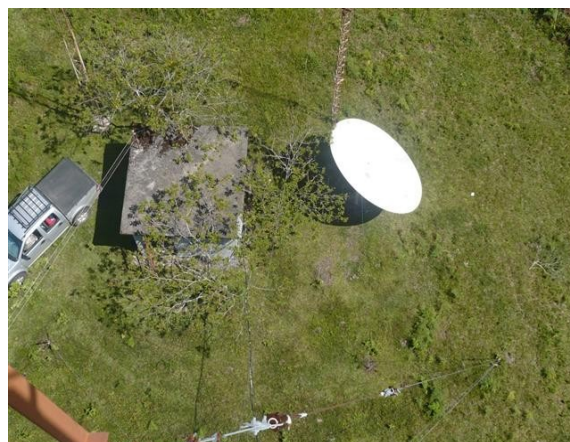
Vista Superior de Estación