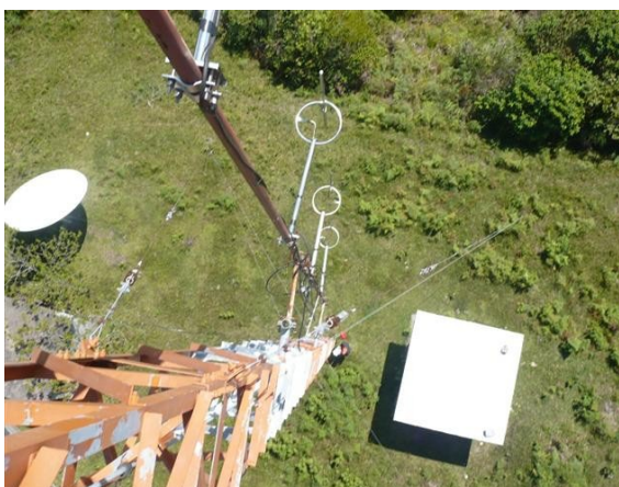
Antenas Radio Comunitaria