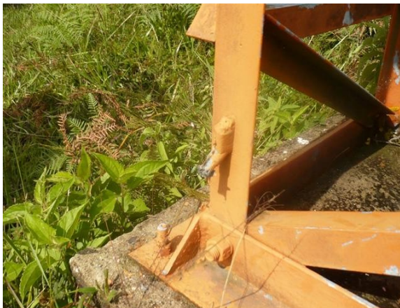
Guayas de tierra Cortadas