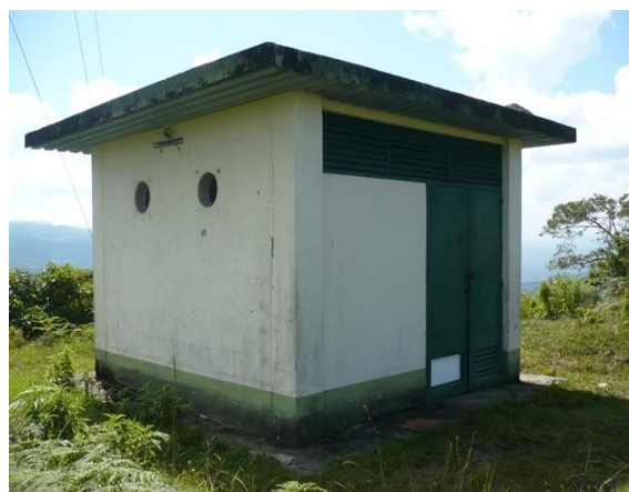
Vista Frontal Caseta