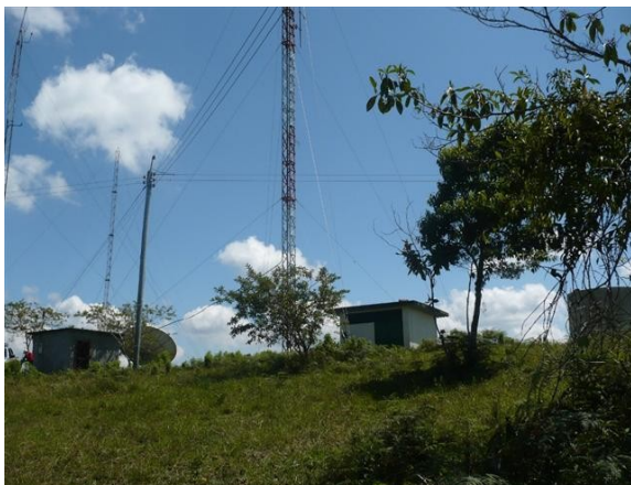
Acometida eléctrica y torre RTVC