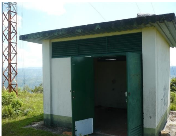
Acceso a Caseta