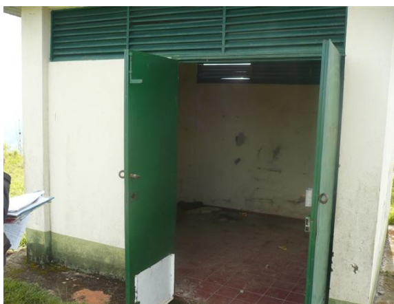
Salón de Equipos (2)