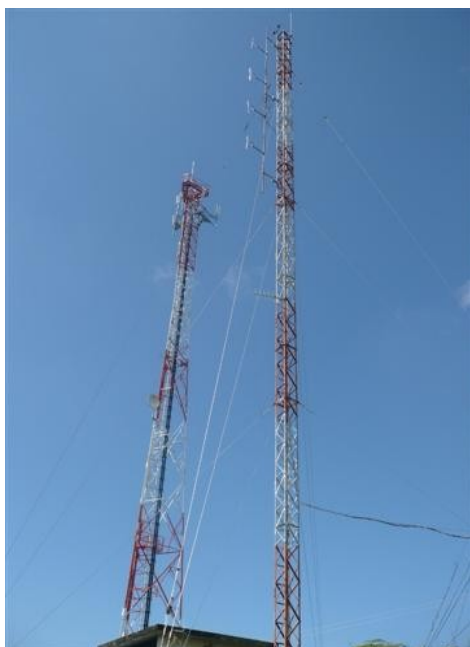
Torre RTVC y Torre cercana