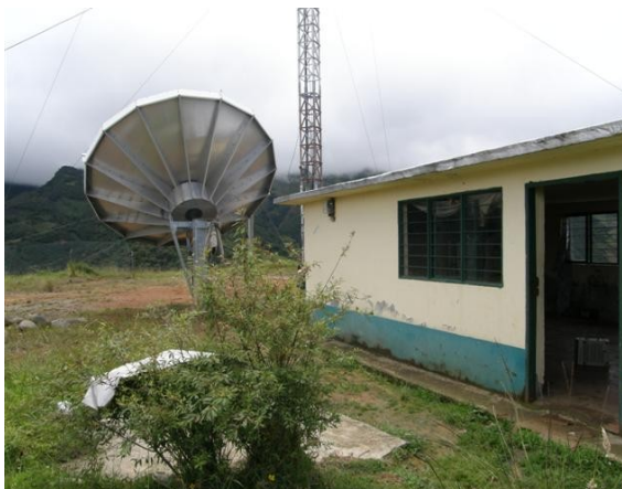
panorámica parabólica y salón de equipos