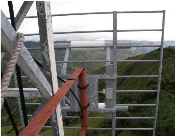
Vista de panel