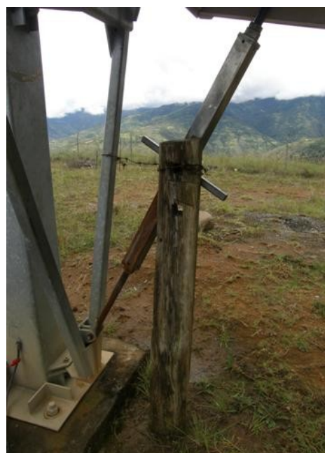
estado de la parabólica