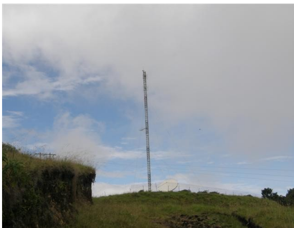
panorámica de la torre