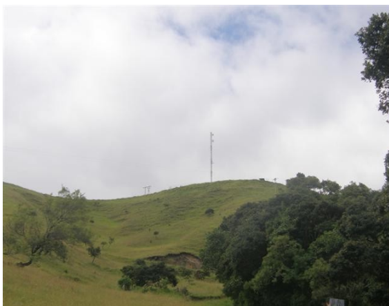
vista panorámica de la torre