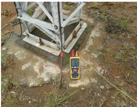
medida de tierra de torre