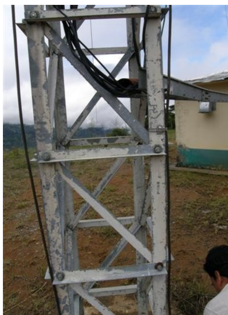
detalle de pintura de la torre