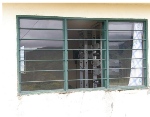
estado de la ventana