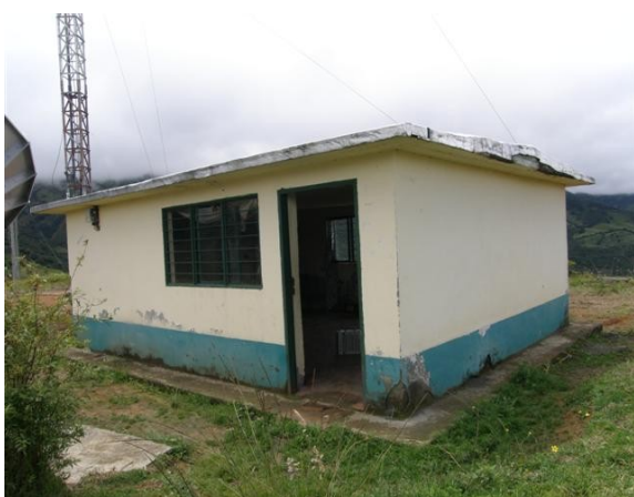
panorámica salón de equipos