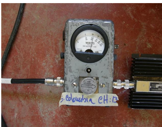
potencia señal Colombia