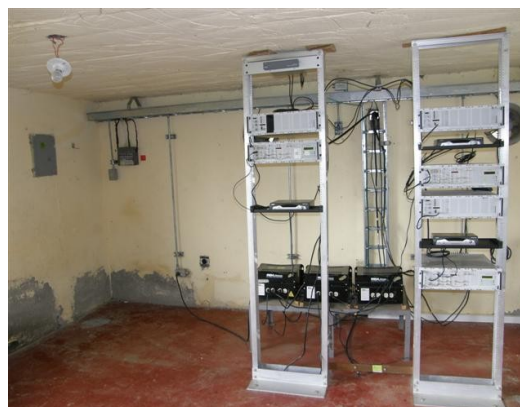
panorámica de los equipos