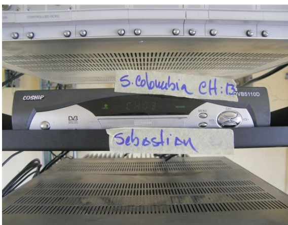
receptor señal Colombia