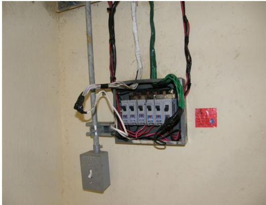
breakers de la estación