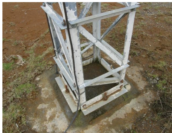
base de la torre