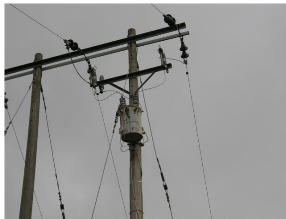
transformador 15 kva