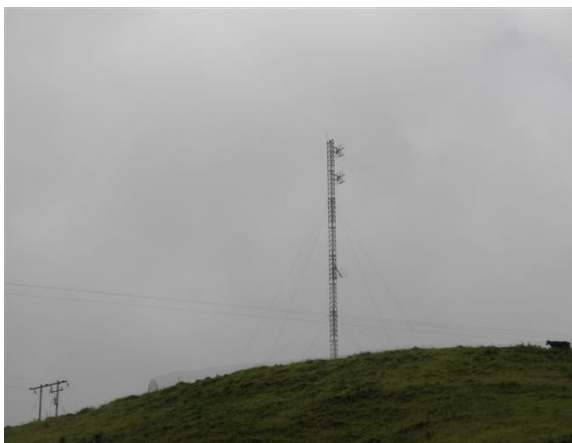
vista panorámica de la torre