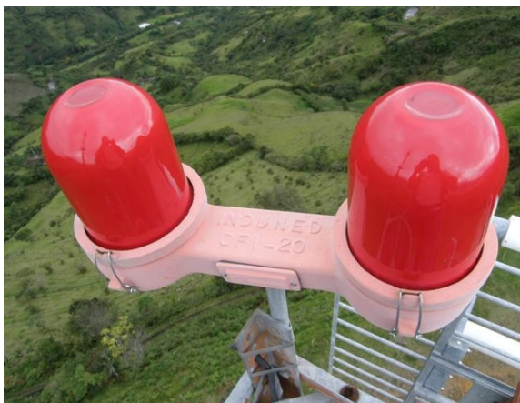
luces de obstrucción