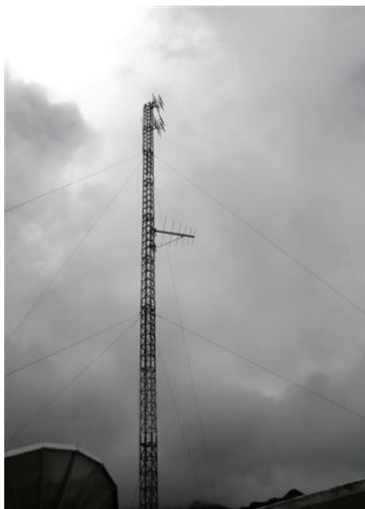
vista general de la torre