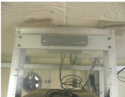
distribuidor de video Extron