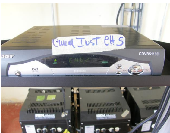
receptor señal institucional