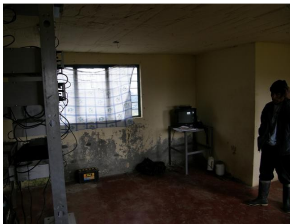
vista interior de la estación