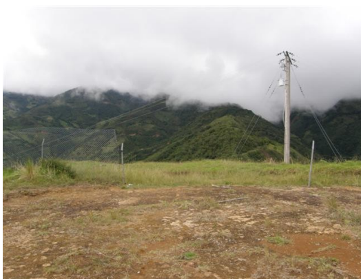
alrededores de la estación