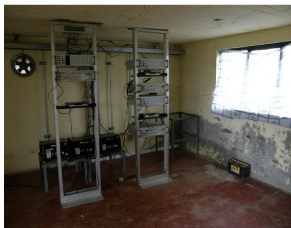
vista salón de equipo