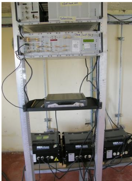
vista de los equipos canal institucional