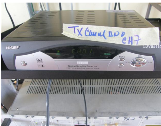
receptor canal uno