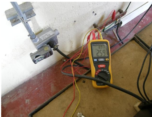
medida de tierra salón de equipos