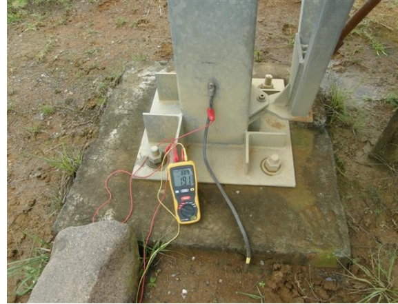
medida de tierra de la parábola