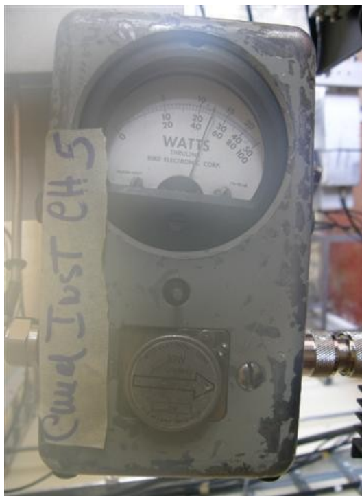
potencia señal institucional