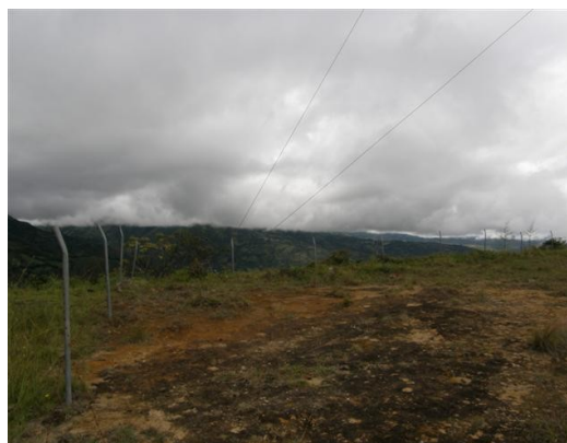
alrededores de la estación