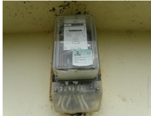
contador de la estación