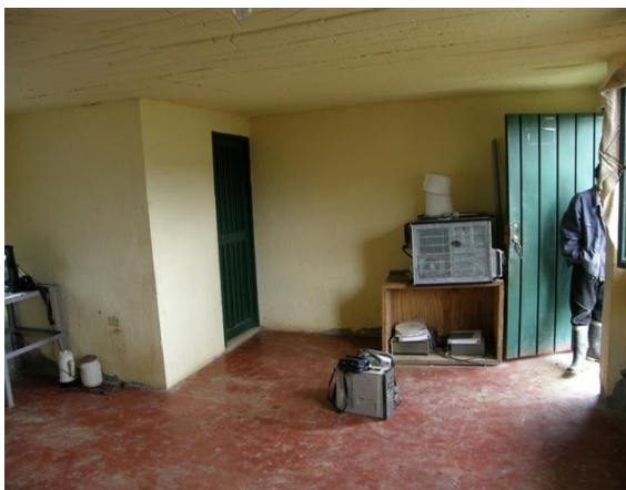
vista interior de la estación