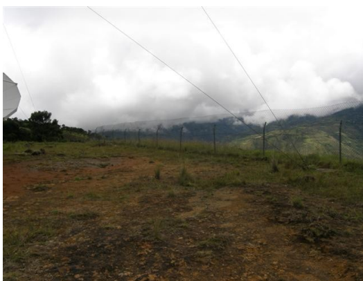
alrededores de la estación