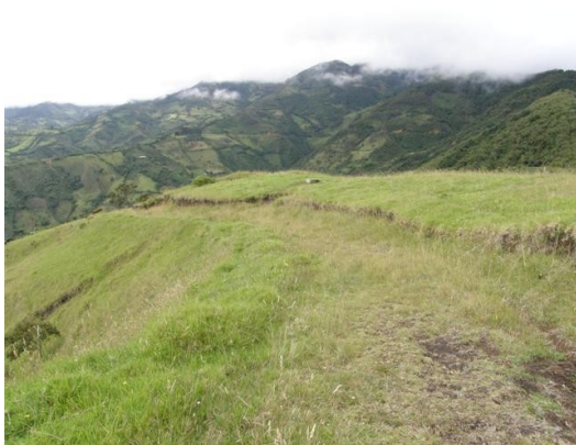
acceso a la estación