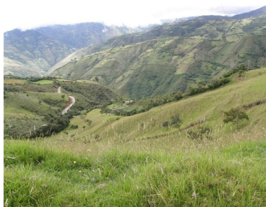
acceso a la estación