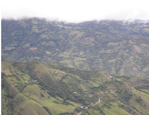
panorámica 90 °