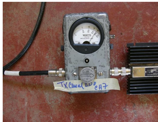
potencia canal uno