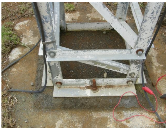
base de la torre