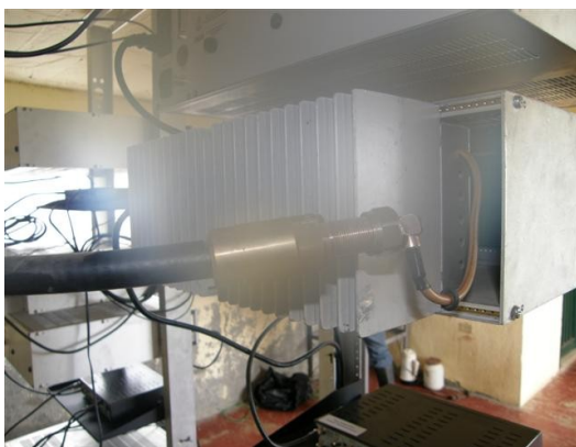
línea de transmisión