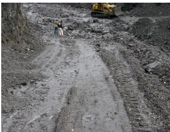
ruta para llegar a San Sebastian