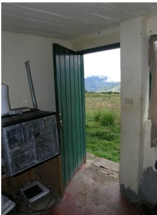
puerta de acceso salón de equipos