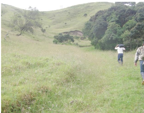
ruta a la estación