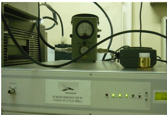
Medida de Potencia Screen Service