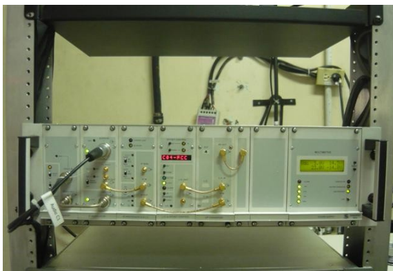
TX Canal Uno