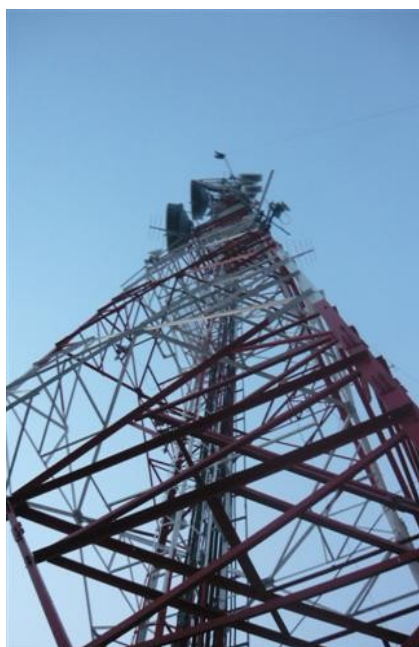
Torre Cara C