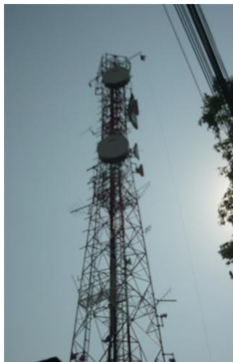
Panorámica Torre 3