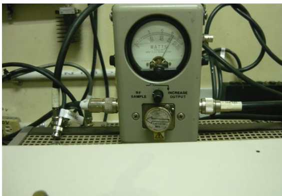
Medición Potencia Señal Colombia.