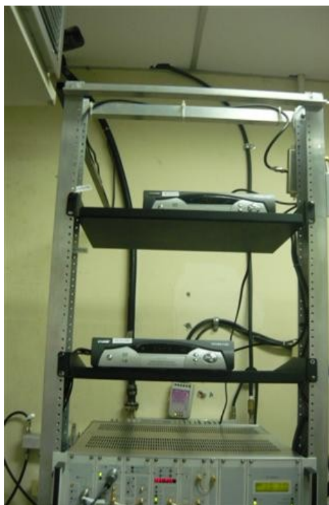
Receptores Satelitales Coship