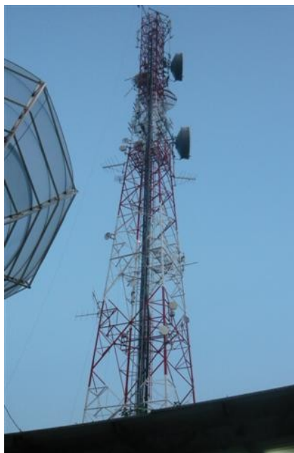
Torre Cara A