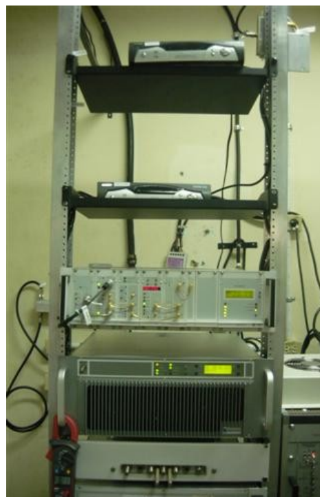
TX Señal Institucional