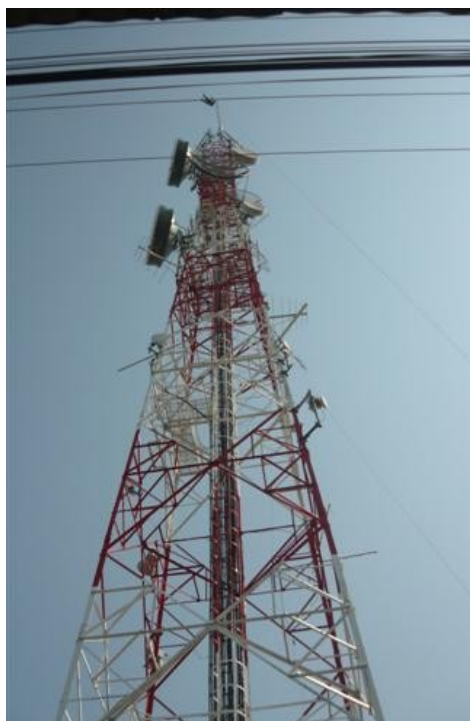
Espacios Libres Torre