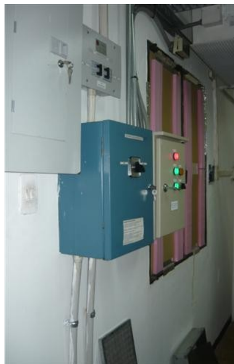
Tablero de control