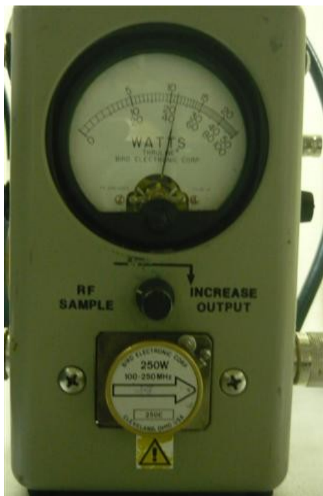
Medición Potencia Señal Institucional