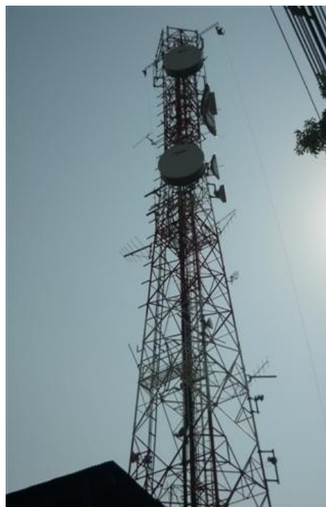
Panorámica Torre 1