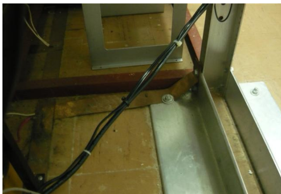
Blindaje de tierra