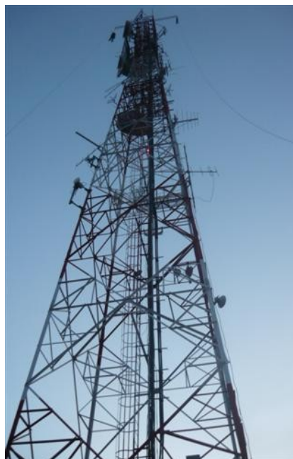
Torre Cara B