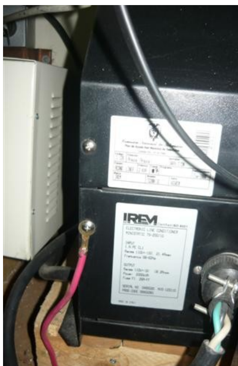
Panorámica IREM 2