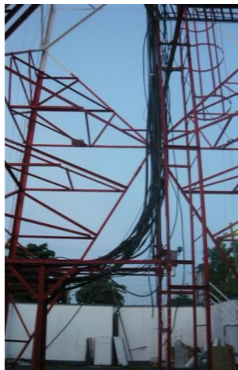
Paso de Cables en torre