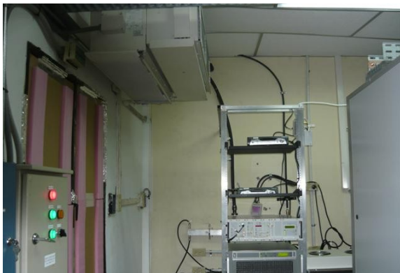
Panorámica Aire Acondicionado