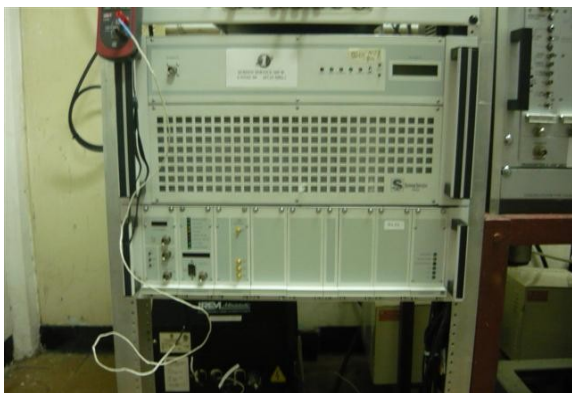
Screen Service Canal Uno