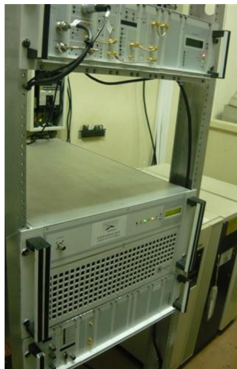
Screen Service Canal Institucional