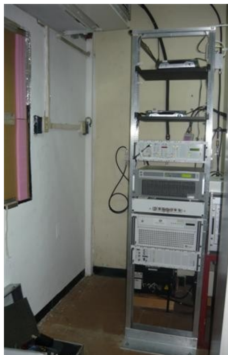
Panorámica Equipo TX TV