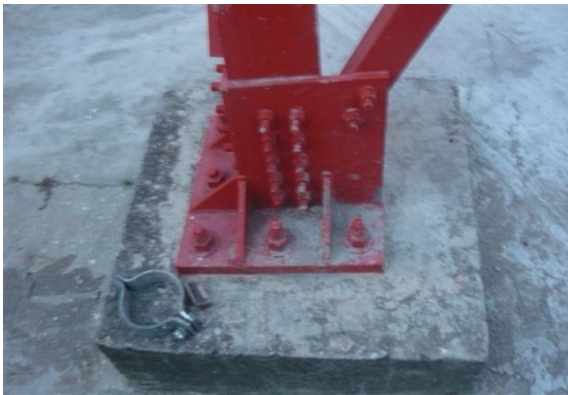
Base de torre