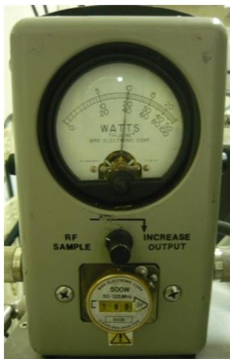
Medición Potencia Canal Uno