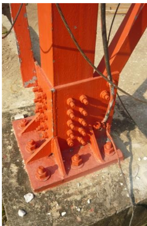
Sistema de tierra torre