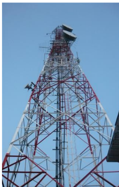
Torre Cara D