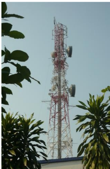
Panorámica Torre 2