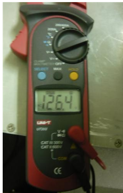
Medición de Línea