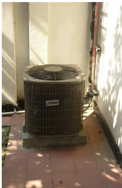
Aire Acondicionado Exterior.