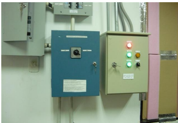
Tablero control Aire Acondicionado