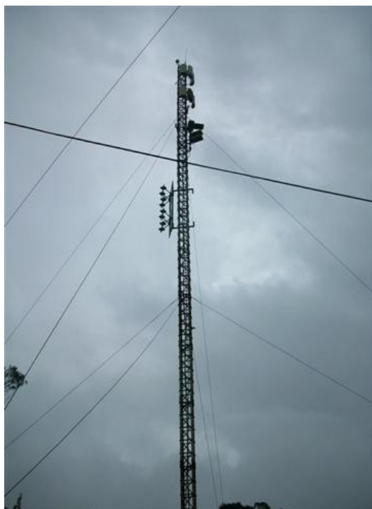
Torre cara C