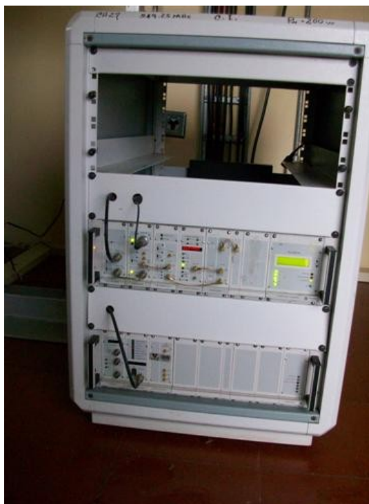
Tx. y offset SI