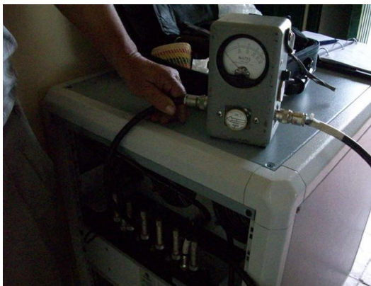
Medida potencia SC