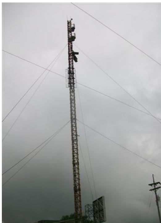
Torre cara D