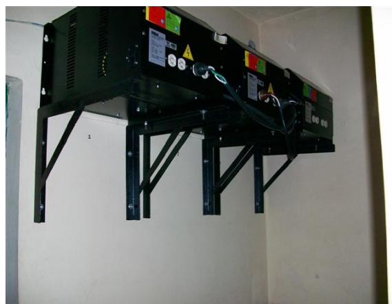
Reguladores C1, SI y SC