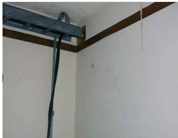
Platina de tierra