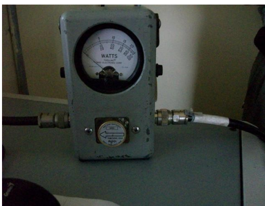
Medida potencia C1