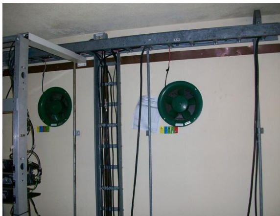
Escalerillas y ventiladores