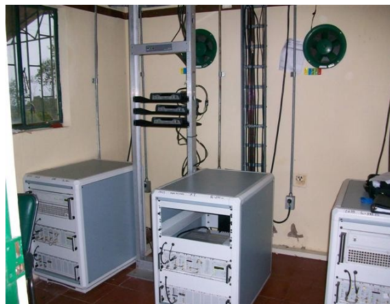
Vista general salón de equipos