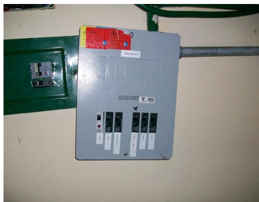
Tablero de distribución