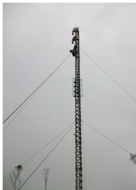
Torre cara B