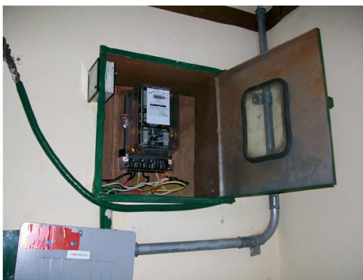
Medidor de energía