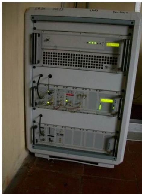
Tx y offset Canal Uno