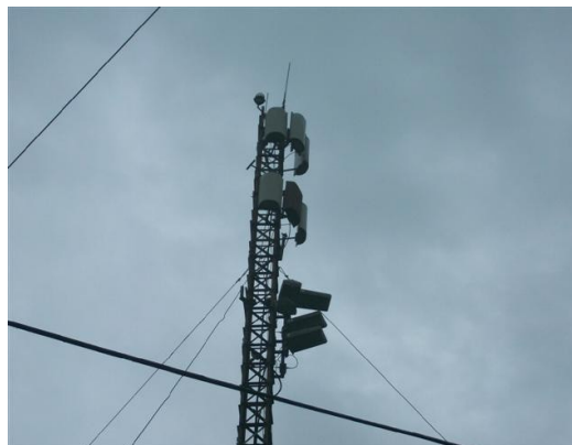
Antenas C1, SI y SC