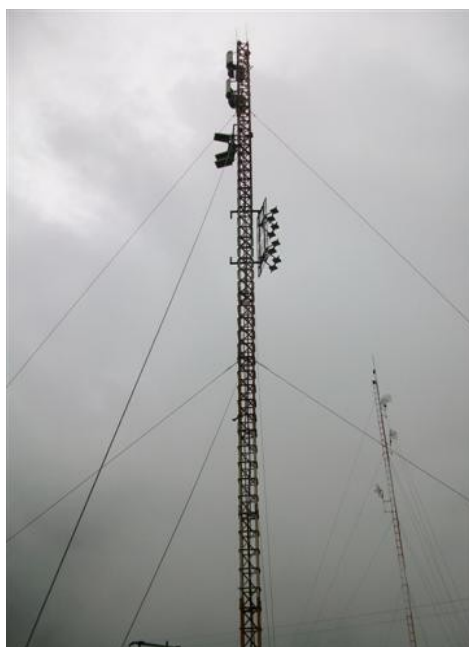
Torre cara A