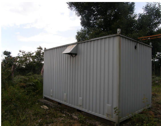
Vista del contenedor