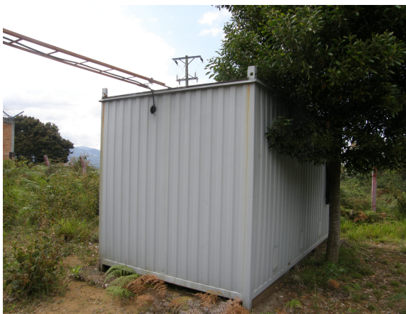
Vista del contenedor