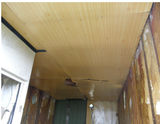
Techo del contenedor