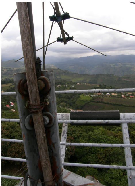
Antena Yagi V4