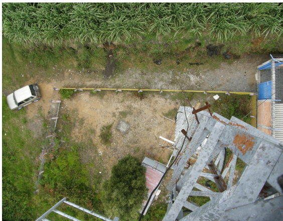
Panorámica superior de la estación