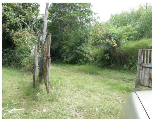
Entrada a la estación