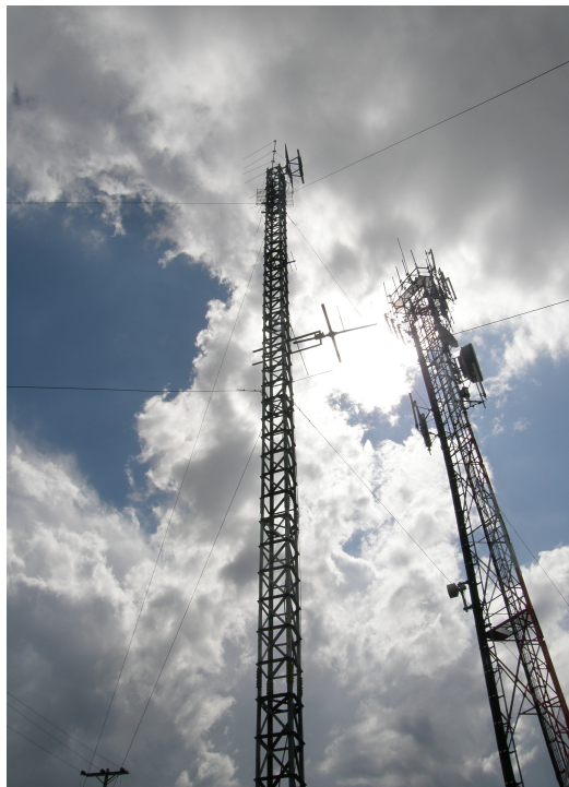
Vista de la torre