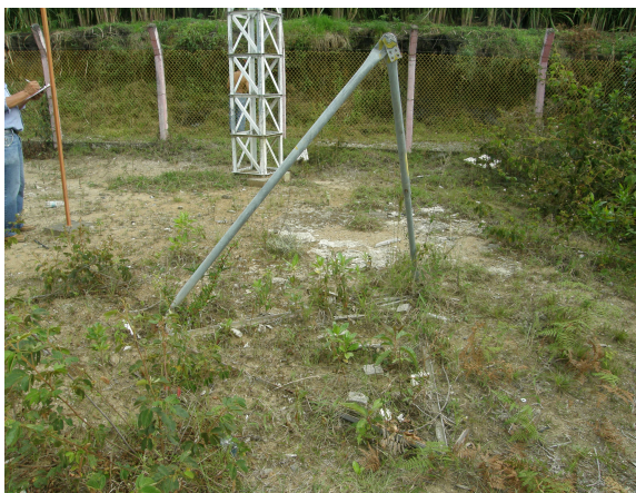
panorámica alrededor de la estación