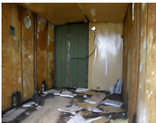
Vista interior del contenedor