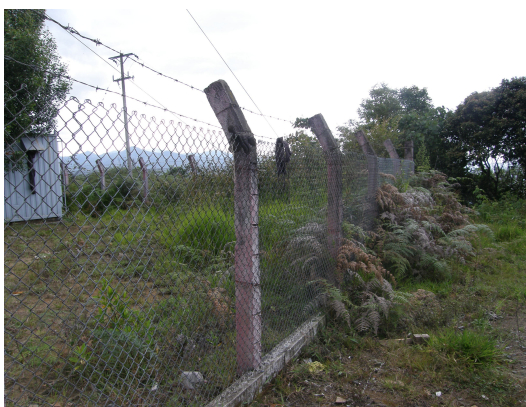
Enmallado de la estación