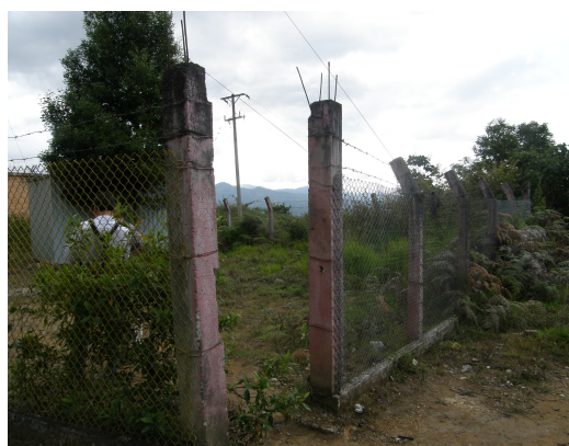
Enmallado de la estación