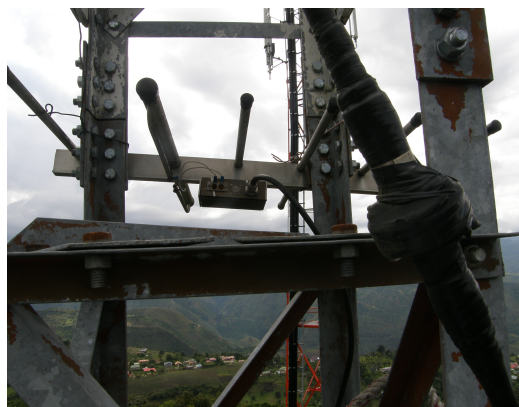
Detalle de la torre