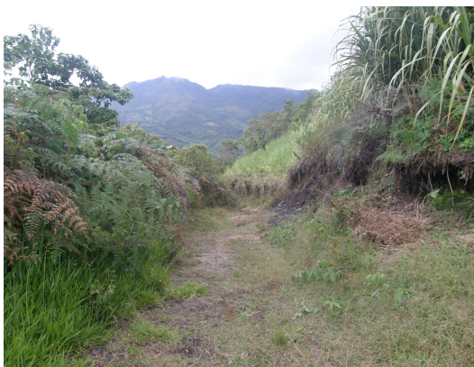
Acceso a la estación