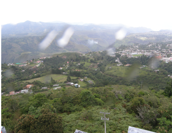
Panorámica del municipio