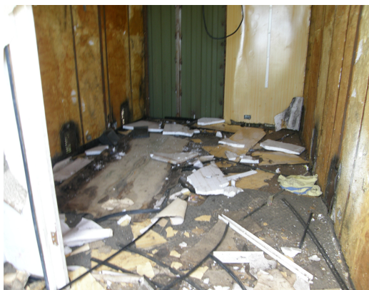
Vista interior del contenedor