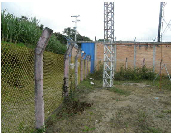
Vista de la torre y escalerilla