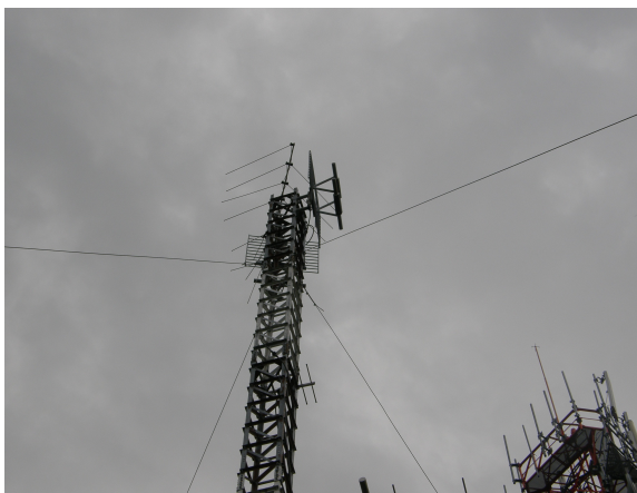
panorámica de las antenas