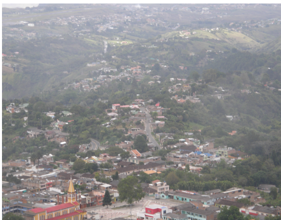
Panorámica del municipio