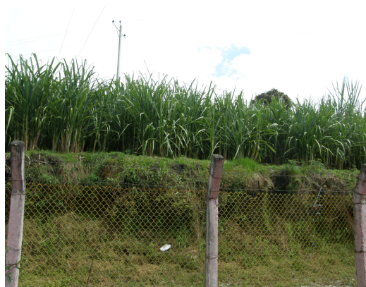
Alrededores de la estación