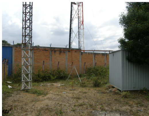
Base de la torre