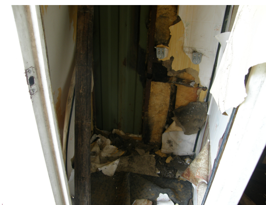
Vista interior del contenedor