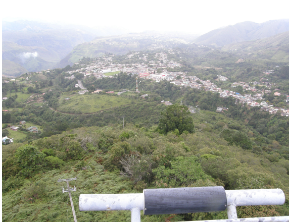
Panorámica del municipio