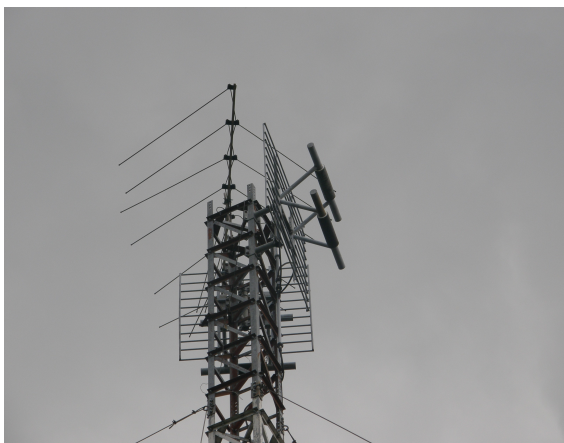
panorámica de las antenas