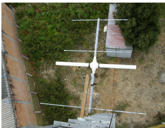
detalles de las antenas