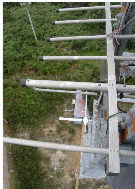
detalles de las antenas