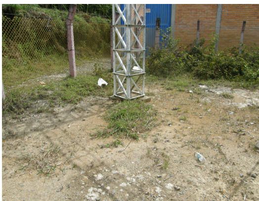
Base de la torre