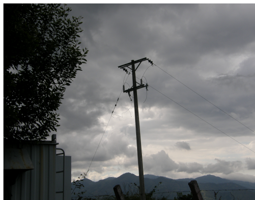
Poste donde estaba el transformador