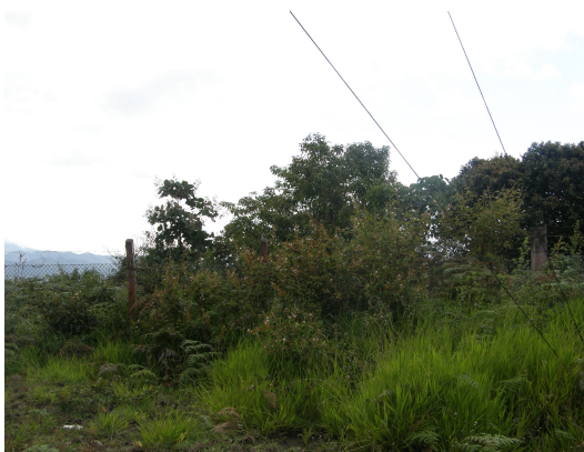
Alrededores de la estación