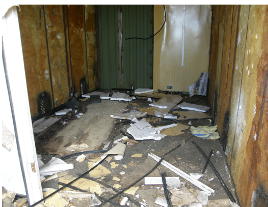
Vista interior del contenedor