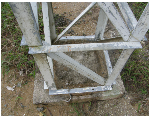
base de la torre