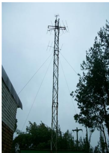
Torre cara C