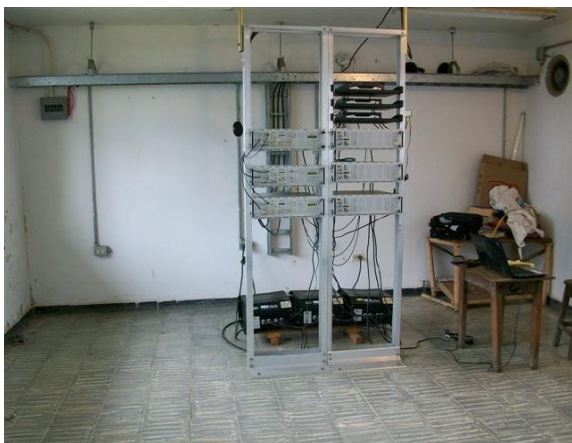
Panorámica salón de Equipos