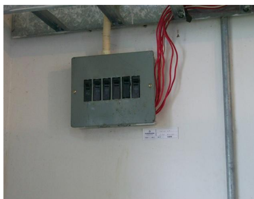
Tablero de distribución