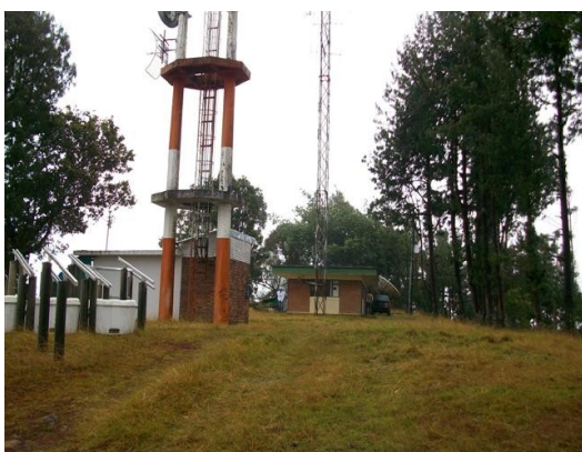
Vista general Estación