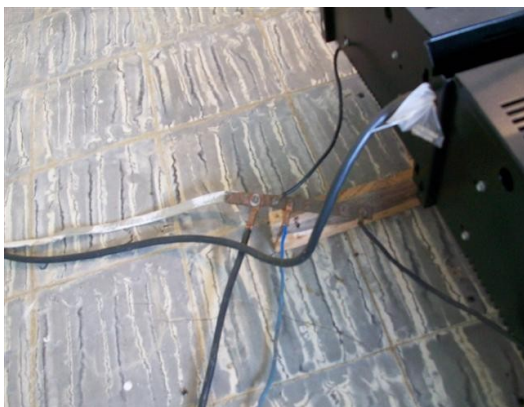
Conexión de tierra