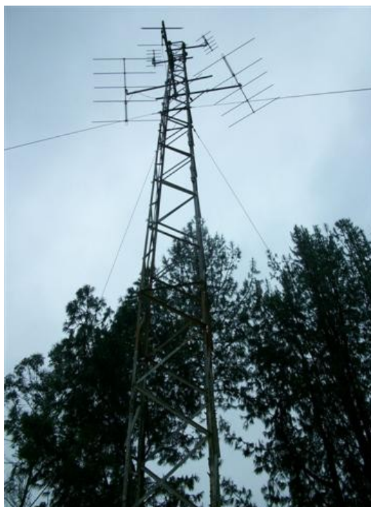
Torre cara D