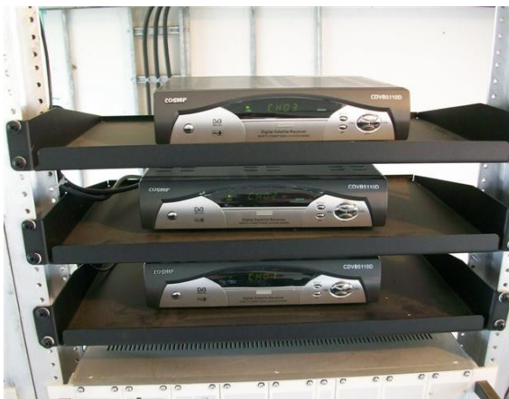
Receptores Satelitales SC, SI y C1