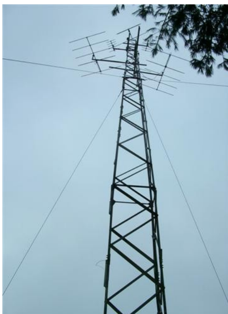
Torre cara B