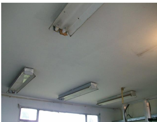
Iluminación S. de E.