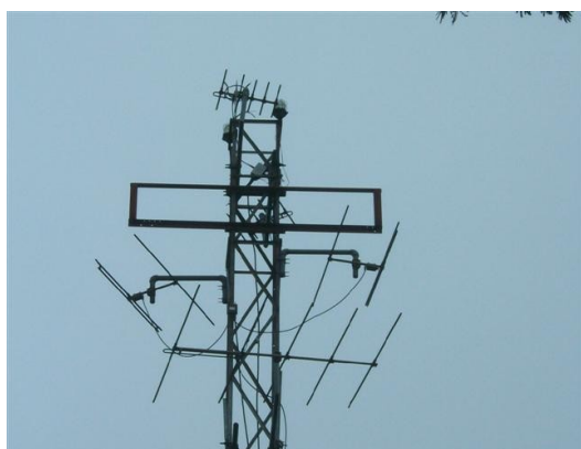
Sistema de antenas C1, SI y SC