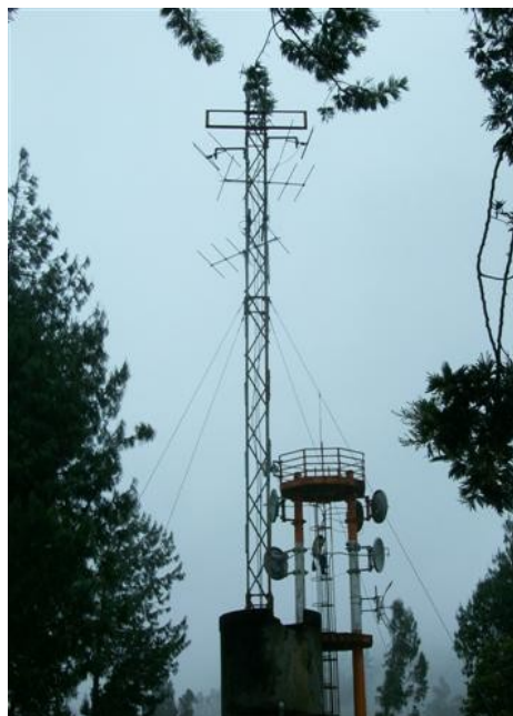
Torre cara A