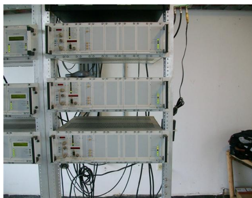
Ofssets C1, SI y SC