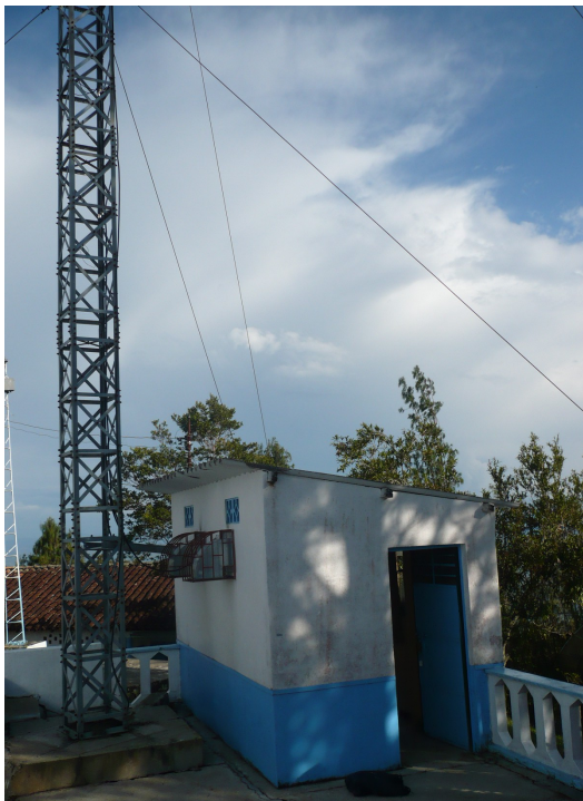
Vista de la torre y salón de equipos