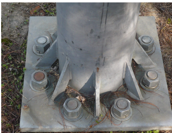
Base antenna parabólica