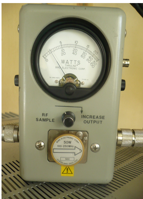
Potencia Canal Uno