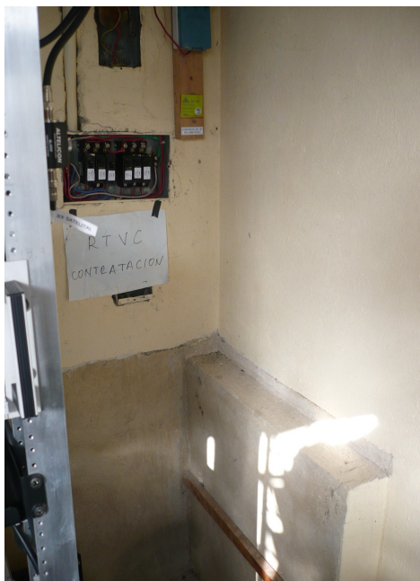
Breakers de la estación