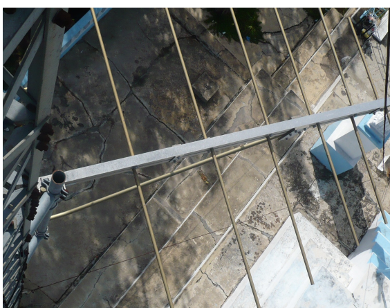
antena yagi vértice 1