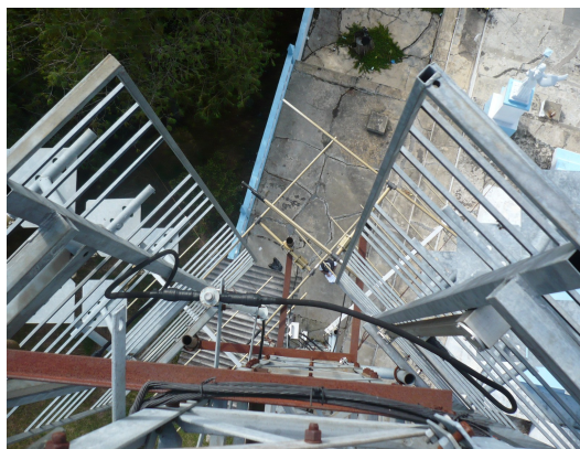
Antena tipo panel TV