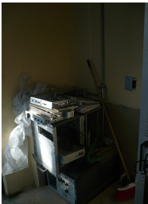
Equipos viejos y dañados