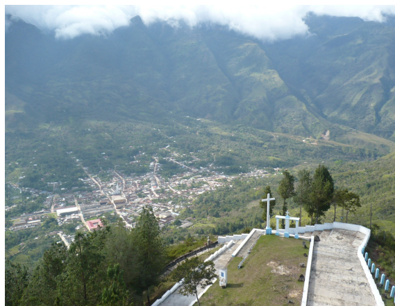
Escaleras de acceso a la estación