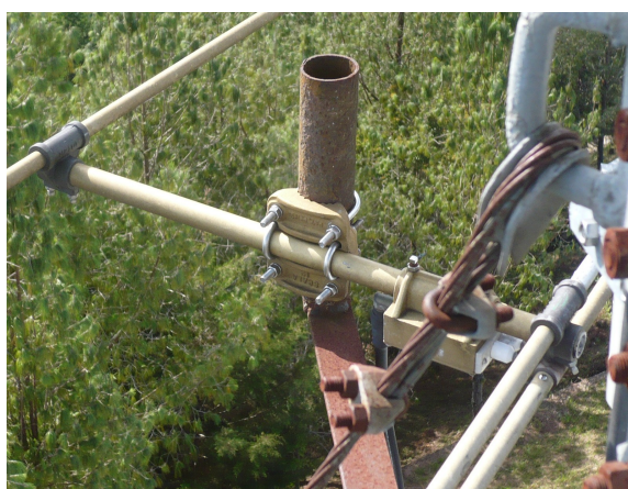
Antena yagi marca Scala