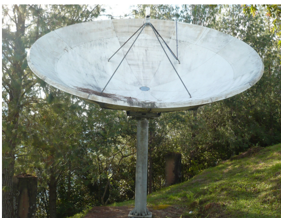
Vista frontal a mayor distancia