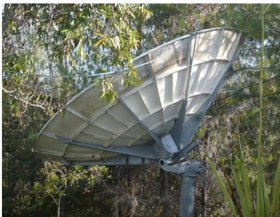
Vista lateral antenna parabólica