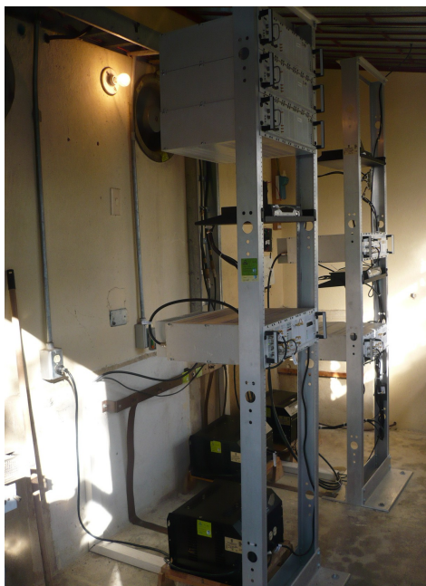
Equipos de transmisión y recepción