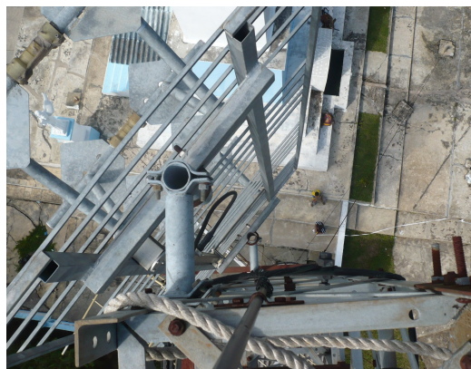
Antena tipo panel