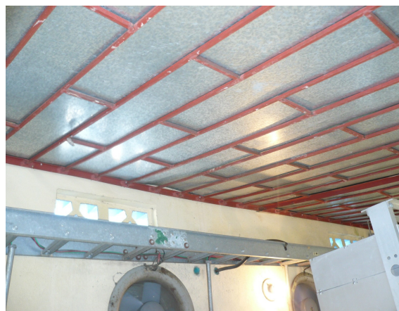
Techo y ventilación del salón de equipos