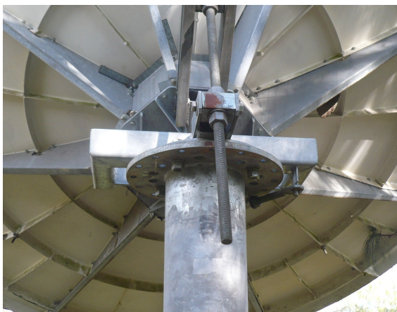
Soporte antenna parabólica