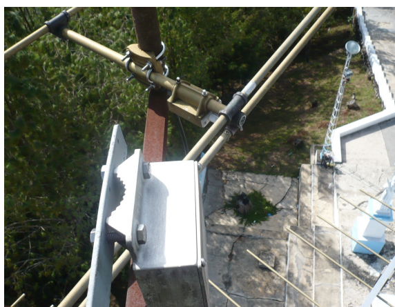
Antena scala superior