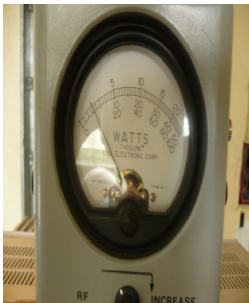
Potencia Señal Colombia