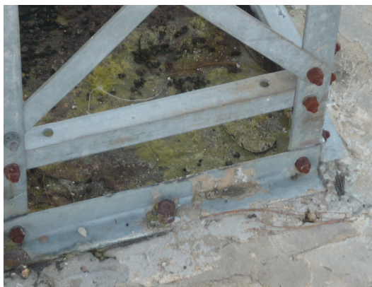
Base torre cara A