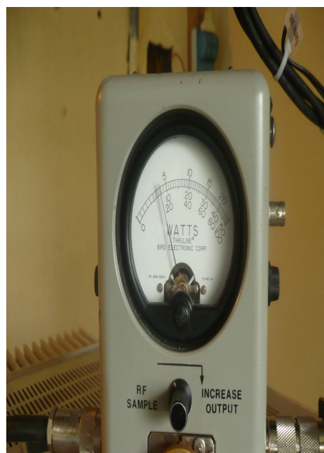
Potencia Señal Institucional