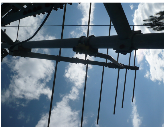
Detalles de la antena yagi