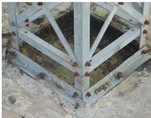
Base torre Vértice 1