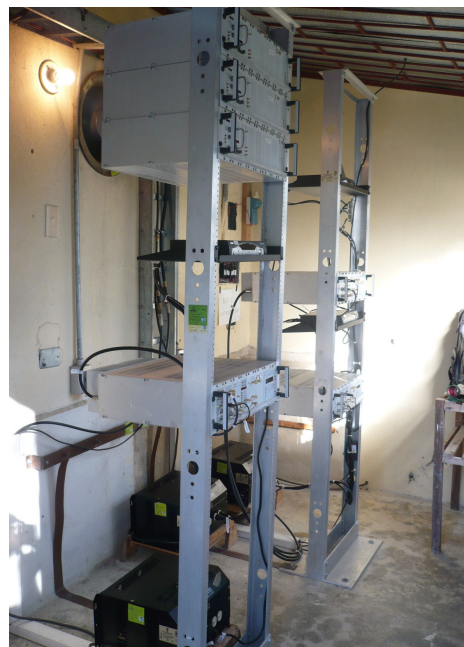
Equipos de Tx y Rx