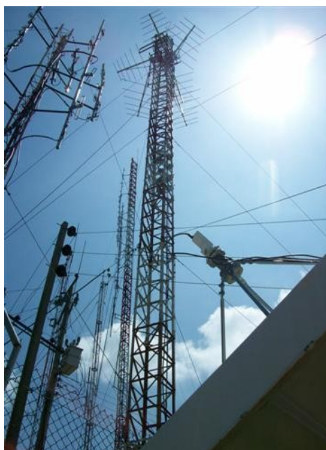
Torre cara A