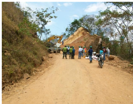
Vía de acceso