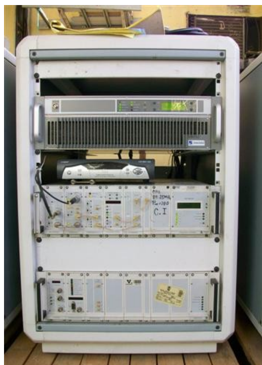
Tx, Receptor Satelital y Offset SI