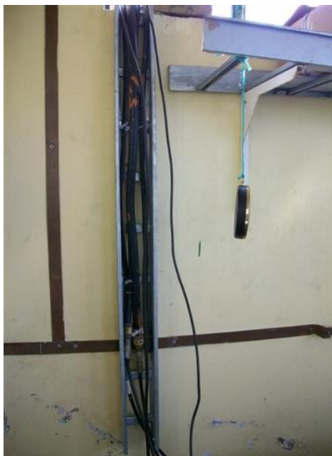
Escalerilla vertical S. de Equipos