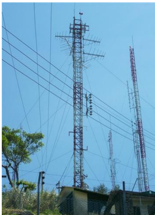
Torre cara D