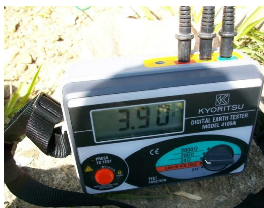
Medida tierra parábola