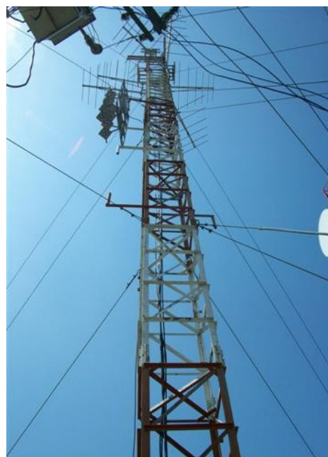
Torre cara B