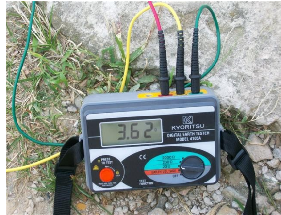
Medida tierra torre