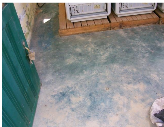
Piso S. de Equipos