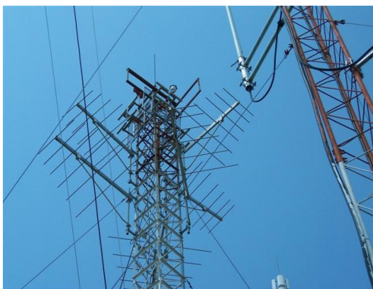
Sistema de antenas C1, SI y SC