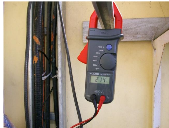
Medida voltaje S-T