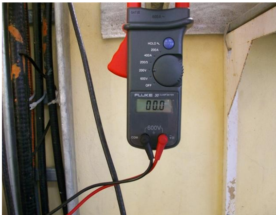
Medida voltaje N-T