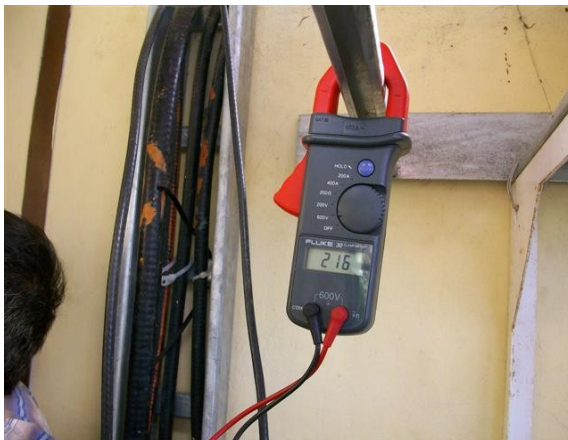
Medida voltaje R-T