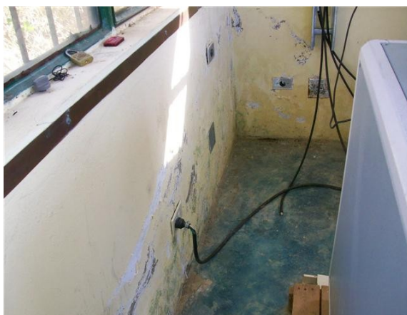
Pared S. de Equipos