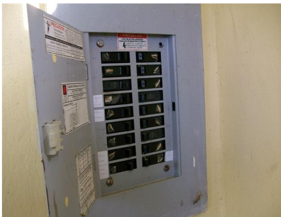
Tablero de distribución de AC