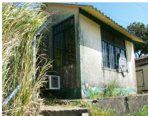
Vista Salón de Equipos