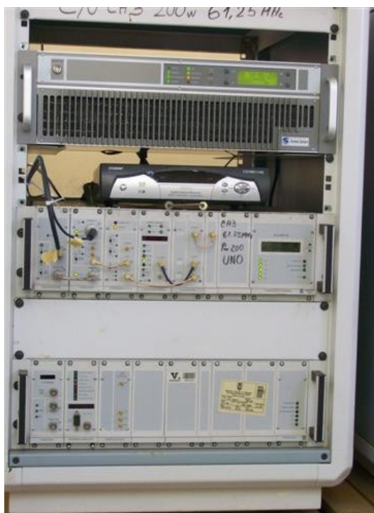
Tx, Receptor Satelital y offset C1