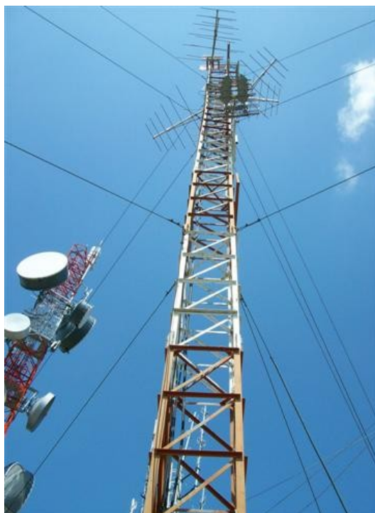
Torre cara C