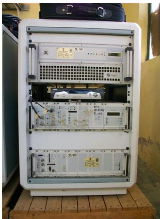
Tx, Receptor Satelital y Offset SC