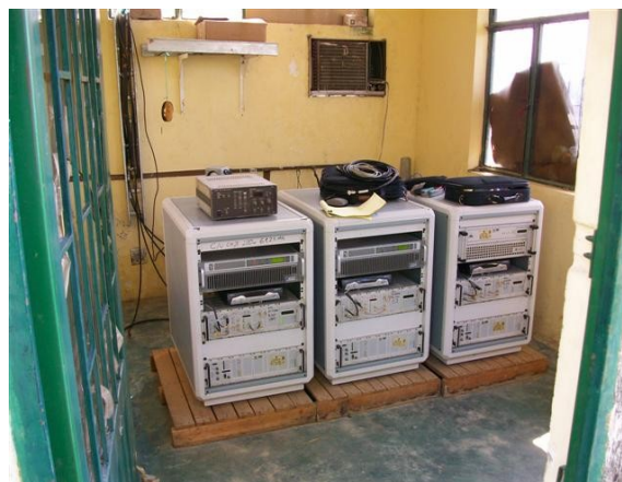
Panorámica S. de Equipos