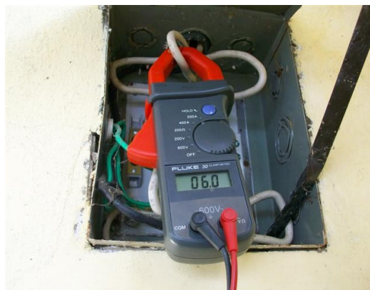
Corriente fase S