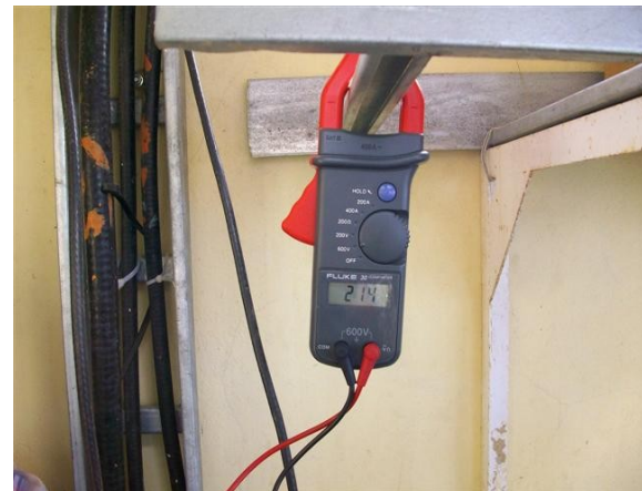
Medida voltaje R-S