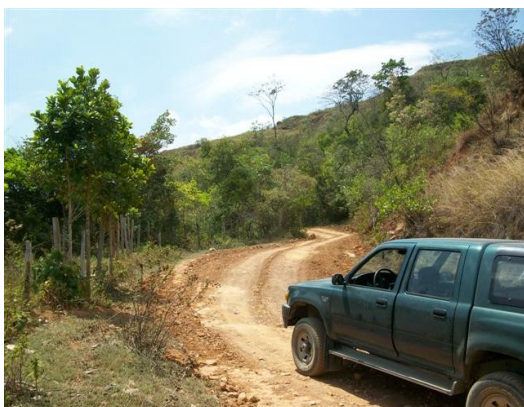
Vía de acceso