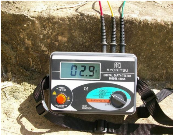
Medida tierra S. de Equipos