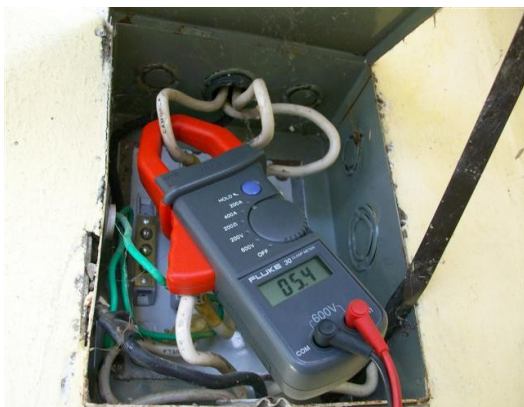
Corriente fase R