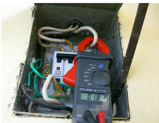
Corriente fase T