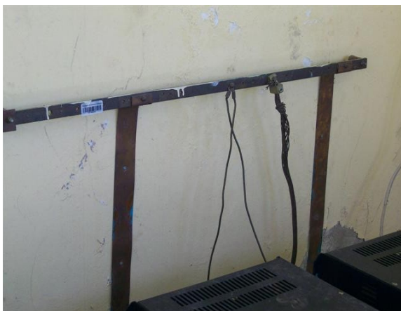
Platina tierra S. de Equipos