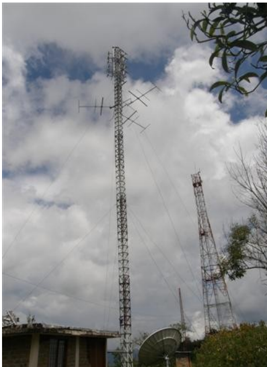
vista general de la torre