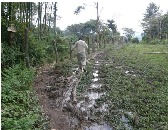
vía desde carretera a cerro