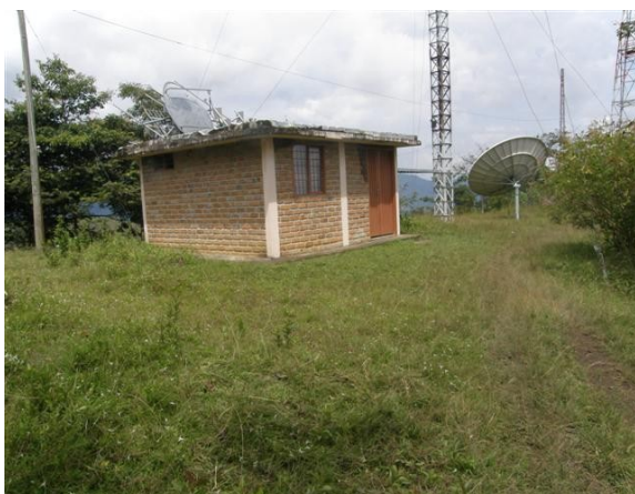
caseta de equipos