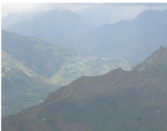
panorámica de Inzá