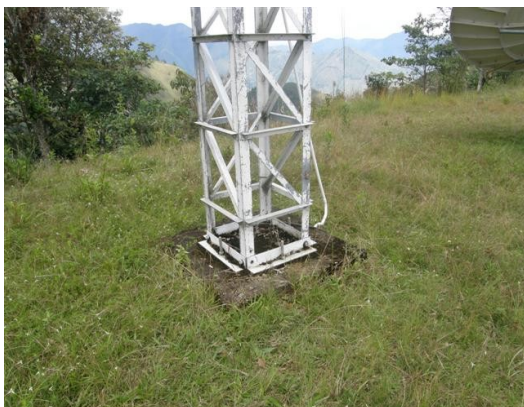
base de la torre