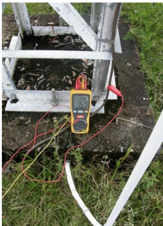
medición tierra torre