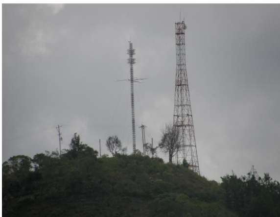
panorámica de la estación