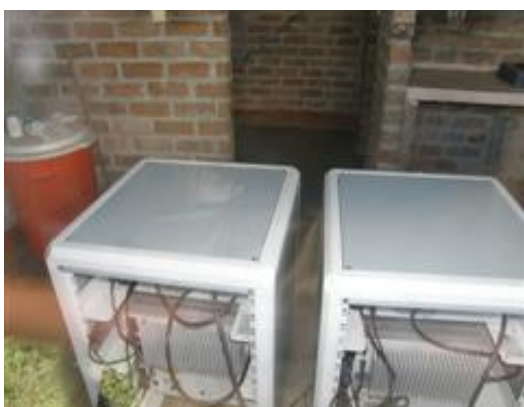
vista de los equipos