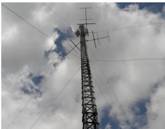
panorámica de las antenas