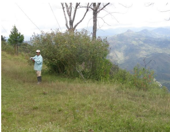
panorámica alrededores de la estación