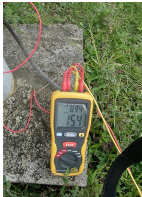
medición tierra de la parabólica