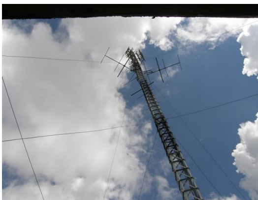
detalle de las antenas