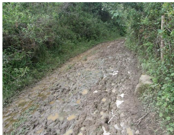
acceso a la estación