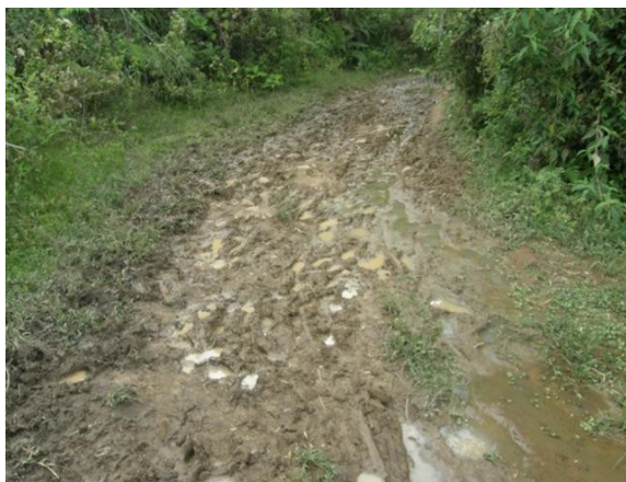
acceso a la estación