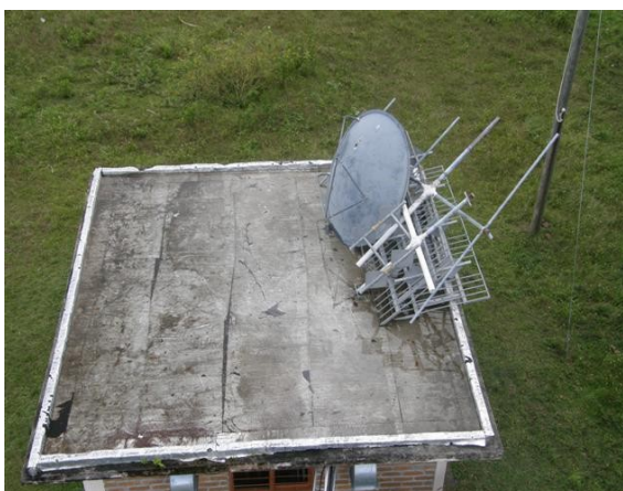
impermeabilizacion de la caseta