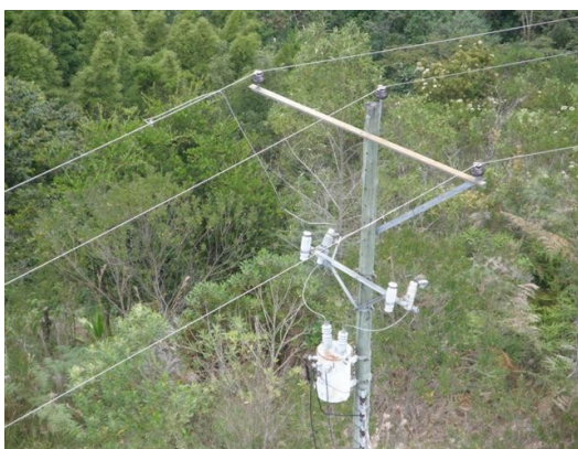
vista del transformador