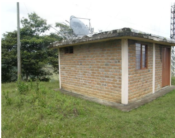
vista exterior de la caseta