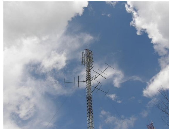
vista de las antenas