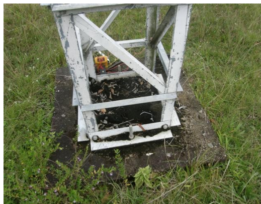
base de la torre