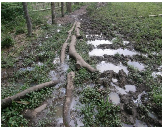
vía a pie de carretera a cerro