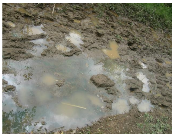
acceso a la estación