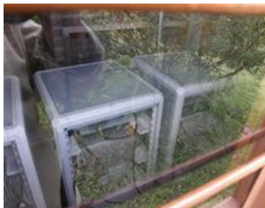
vista de los equipos