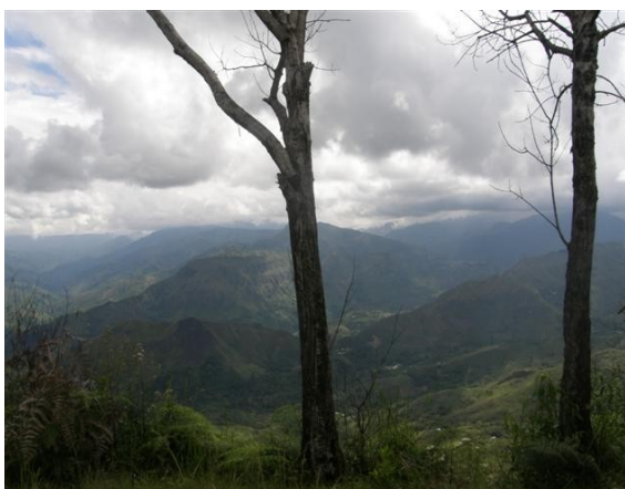
panorámica alrededores de la estación