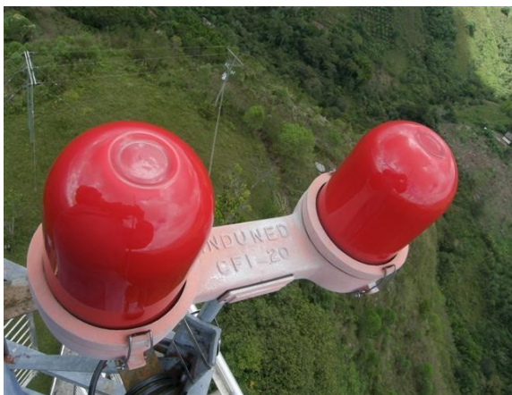
luces de obstrucción