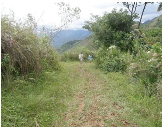
subida al cerro