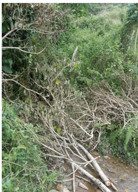
acceso a la estación