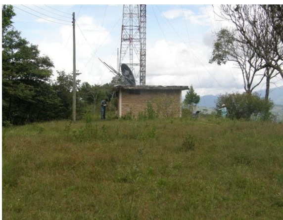
panorámica alrededores de la estación