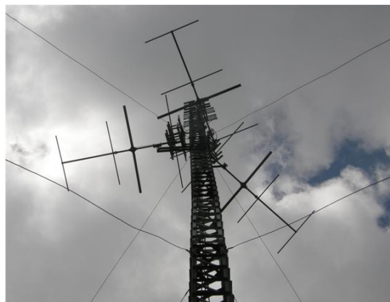
detalles de las antenas