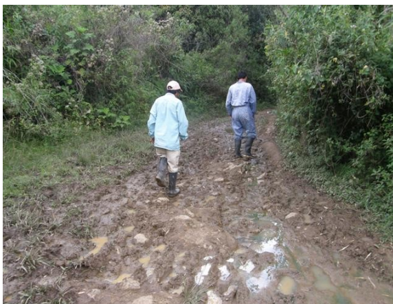
vía a pie desde carretera a cerro