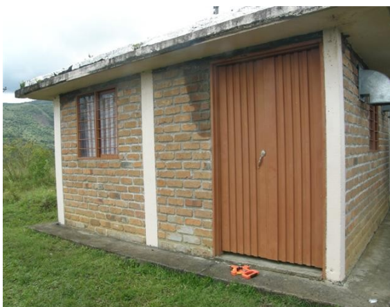
panorámica de la caseta