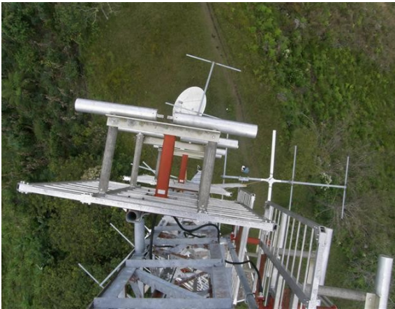
vista superior del panel