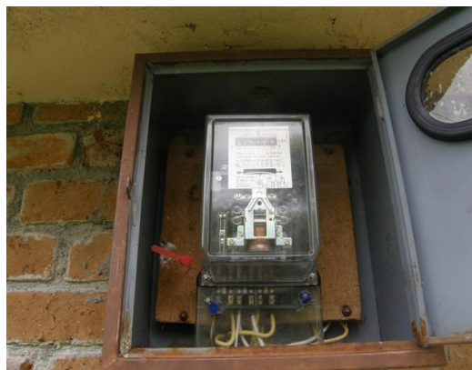
contador de la estación