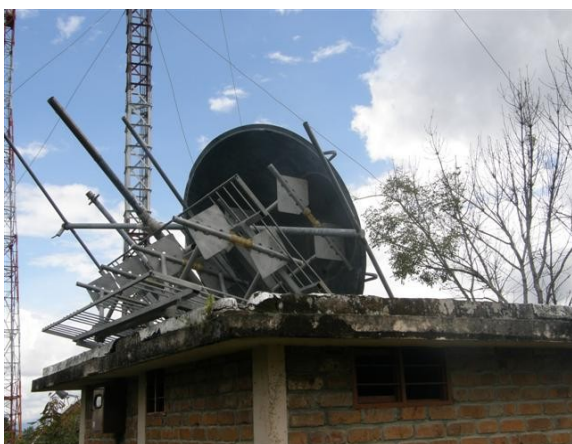
panorámica de la caseta