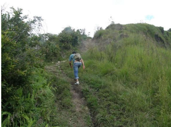
subida al cerro