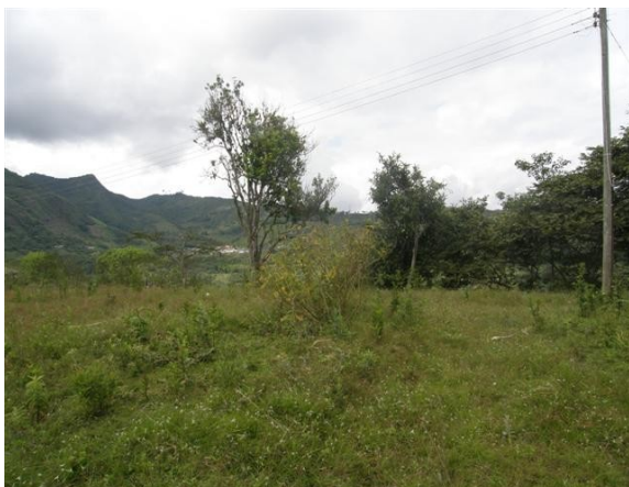
alrededores de la estación