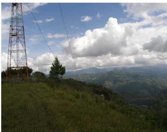
panorámica alrededores de la estación