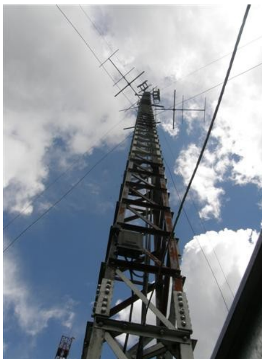
panorámica de la torre