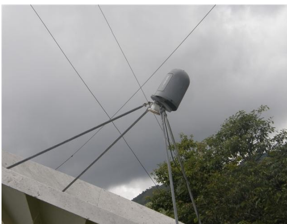
LNB de la antena parabólica