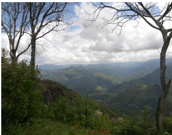
alrededores de la estación