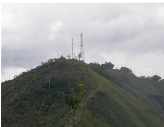
Panorámica de la estación