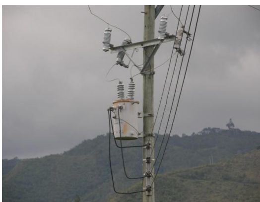
panorámica del transformador