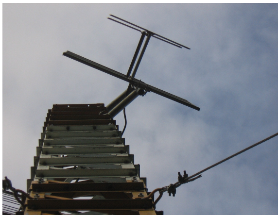
Espacio disponible Fig.2