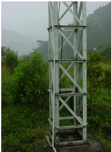
Detalle de pintura torre