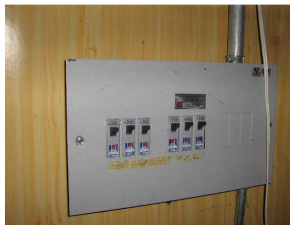
Tablero de breakers