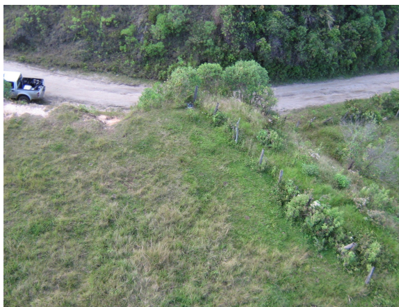
Acceso a estación Fig.3