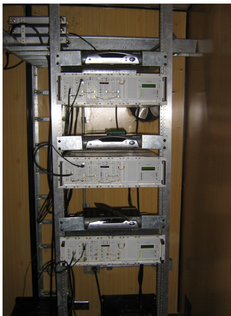
Equipos de transmisión