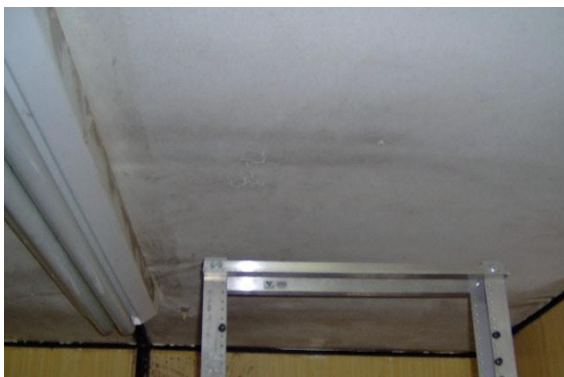
Pintura interior Fig.1