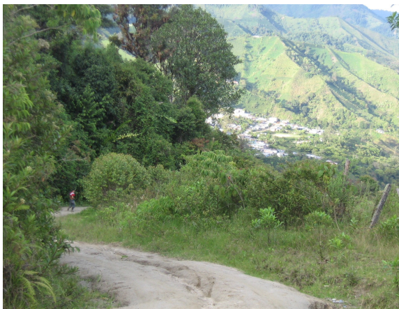
Vía de acceso Fig.1