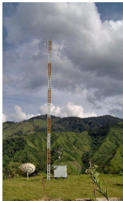
Acceso a estación Fig.2