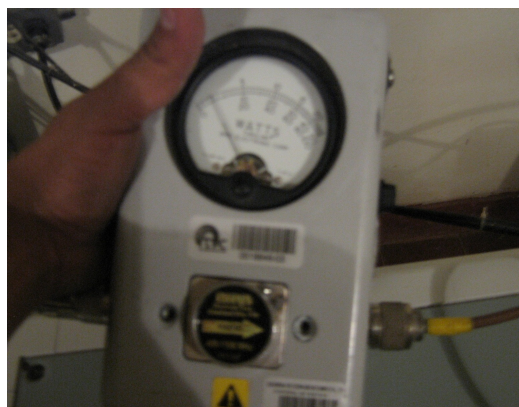
Potencia Señal Colombia