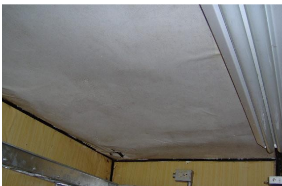
Pintura interior Fig.2