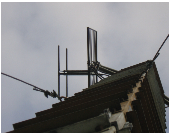
Espacio disponible Fig.3