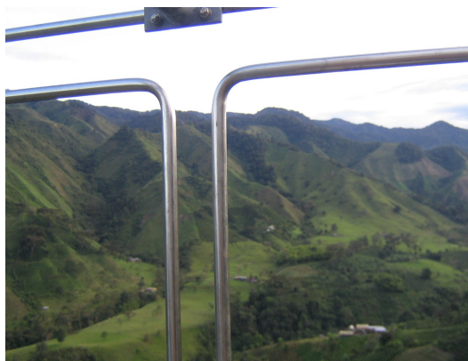
Vista panorámica antena 2