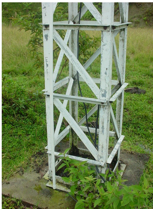
Sección de los ángulos de la Base Fig.1