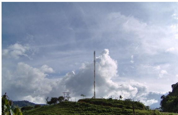
Acceso a estación Fig.1