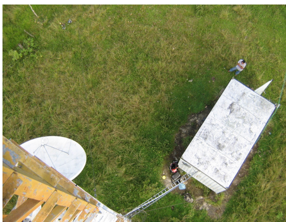
Escalerilla exterior Fig.2