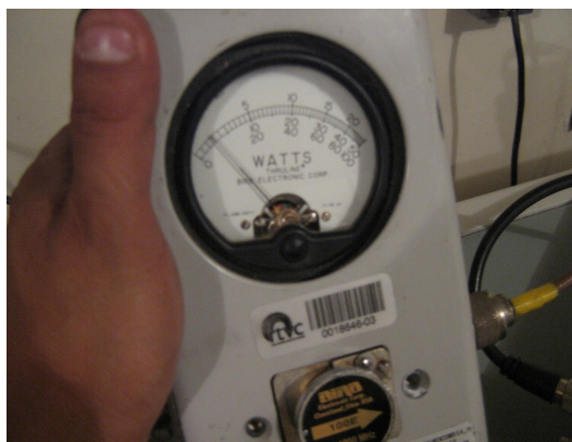
Potencia Canal Uno