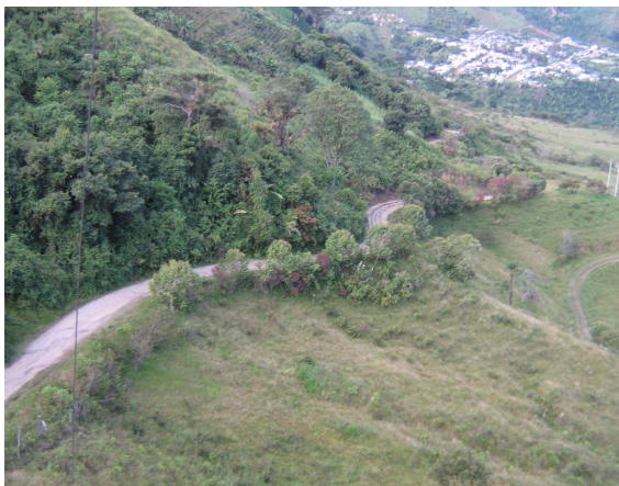
Vía de Acceso Fig.2