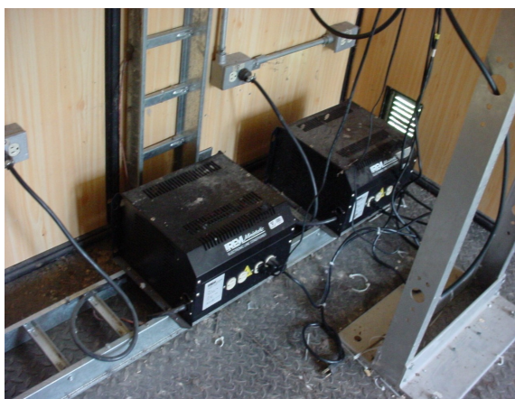
Acondicionadores de línea