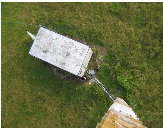
Recorrido de cables Fig.1