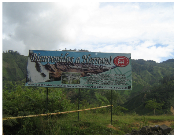
Ingreso al municipio