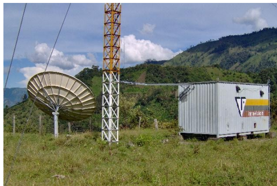
Escalerilla exterior Fig.1