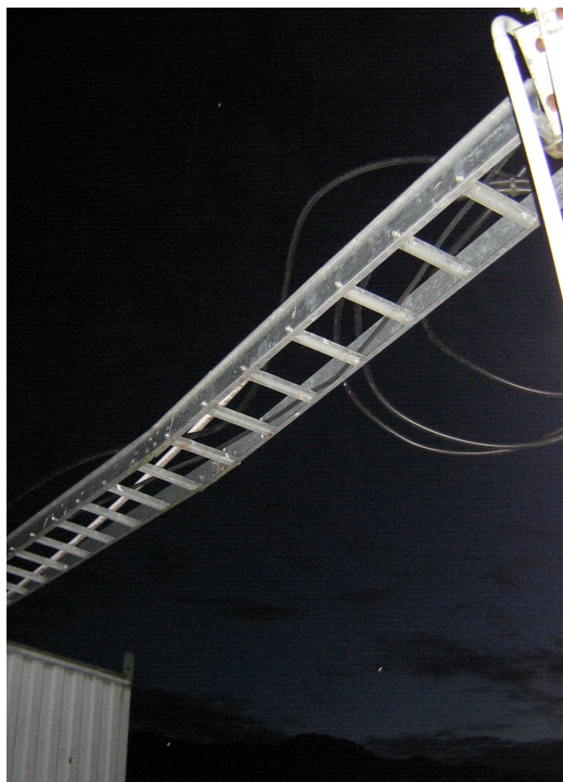
Recorrido de cables Fig.3