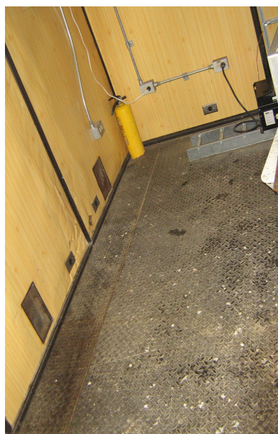
Espacio disponible y extintor