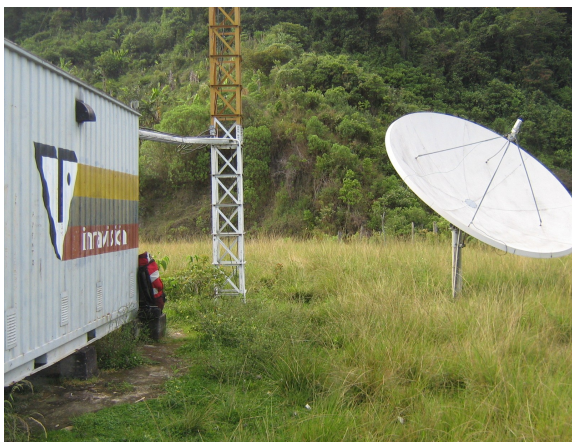
Recorrido de cables Fig.2