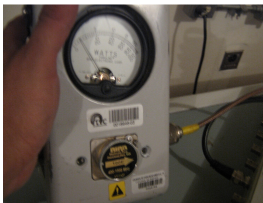
Potencia Señal Institucional