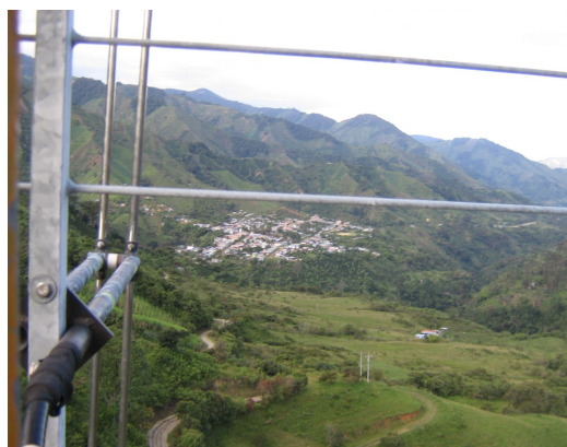
Vista panorámica antena 1