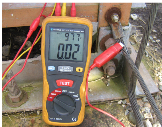
Medición sistema de tierra torre