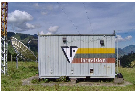
Pintura exterior Fig.1