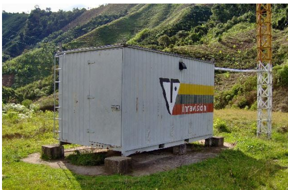
Pintura exterior Fig.2