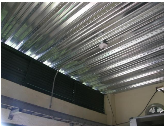
techo de la estación