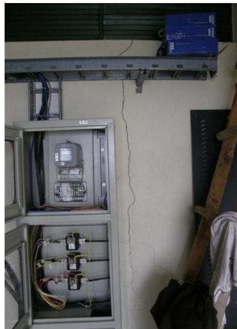
breakers de la estación