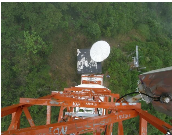
vista superior de la estación