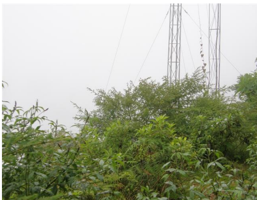
acceso a la estación