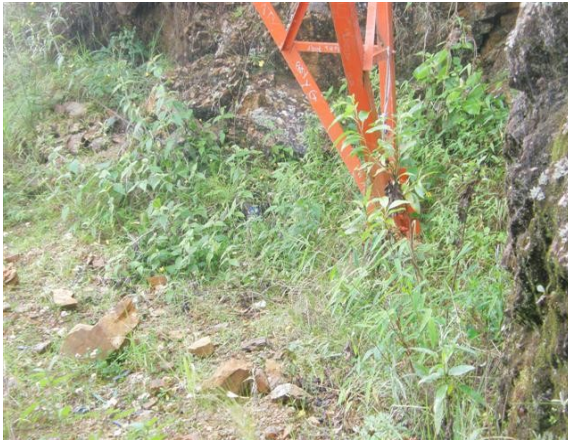
base de la torre