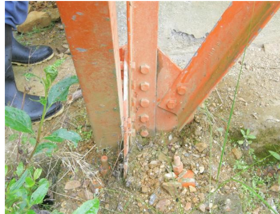
base de la torre