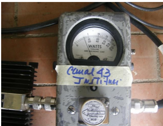
potencia señal institucional