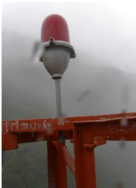
luces de obstrucción