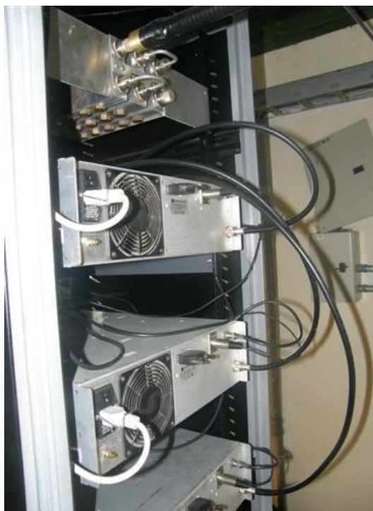
vista posterior de los equipos