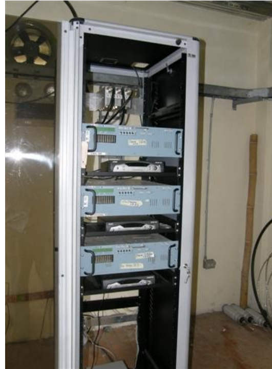
Rack con transmisores