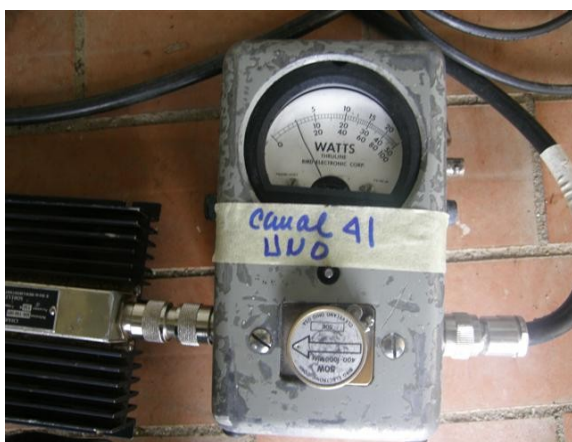
potencia canal uno