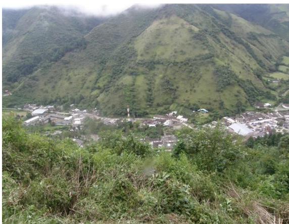
Panorámica de la vega