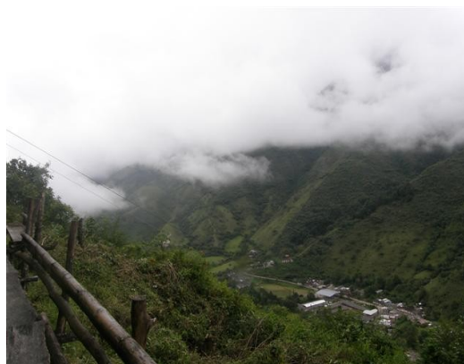
Panorámica de la vega