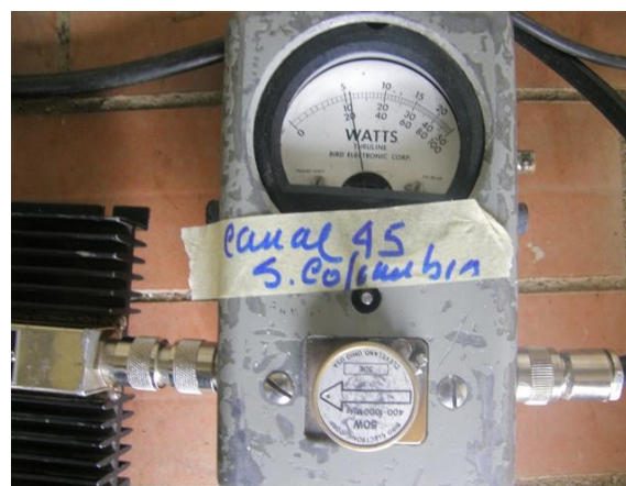
potencia señal Colombia