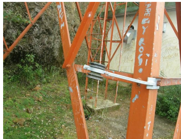
detalle de la torre