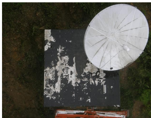
impermeabilizacion y parabólica