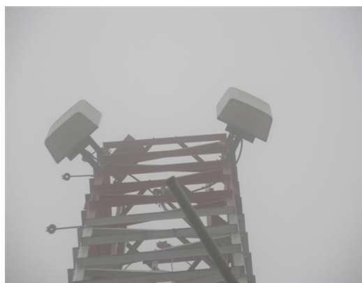
panorámica de las antenas