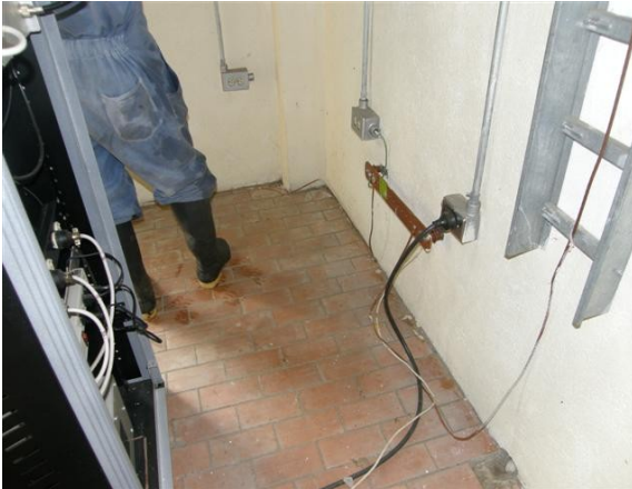
platina de tierra