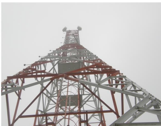
vista de la torre