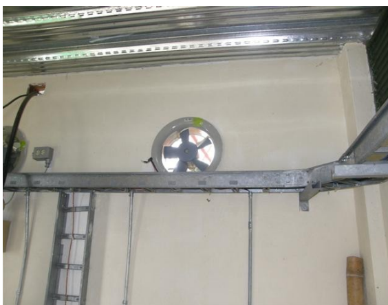
extractor y escalera