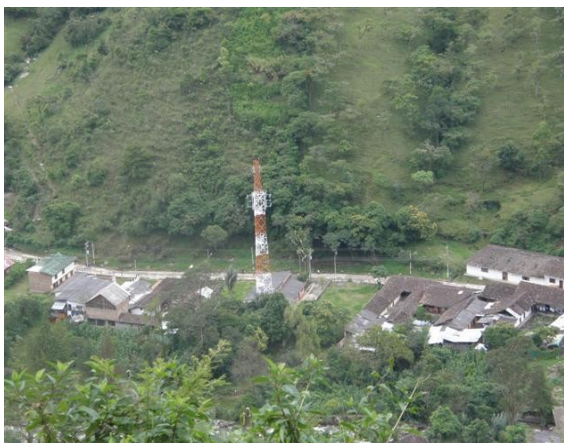
Panorámica de la vega