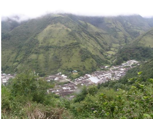
panorámica de la Vega