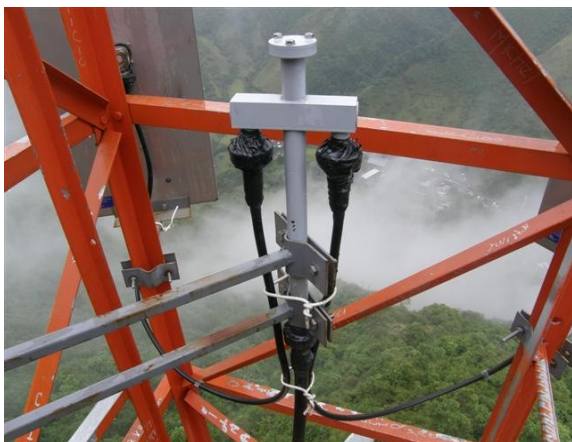
distribuidor de antenas