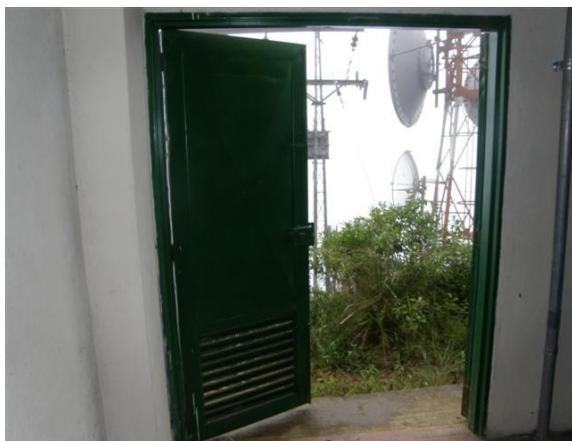
acceso salón de equipos