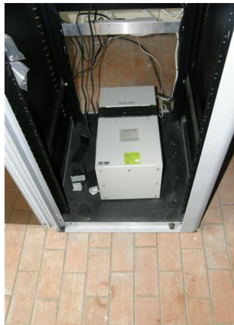
Acondicionador de línea