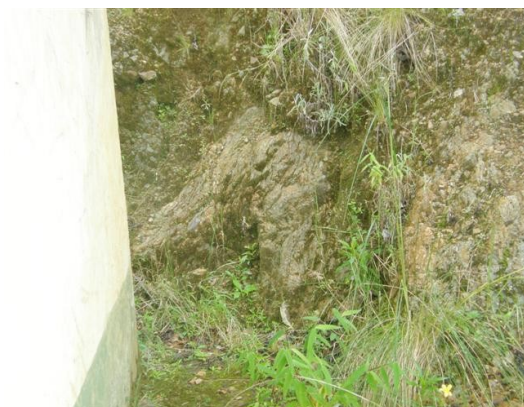
alrededores de la estación