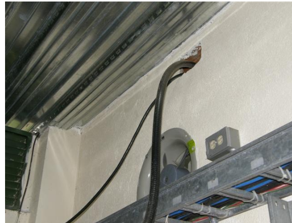
techo de la estación