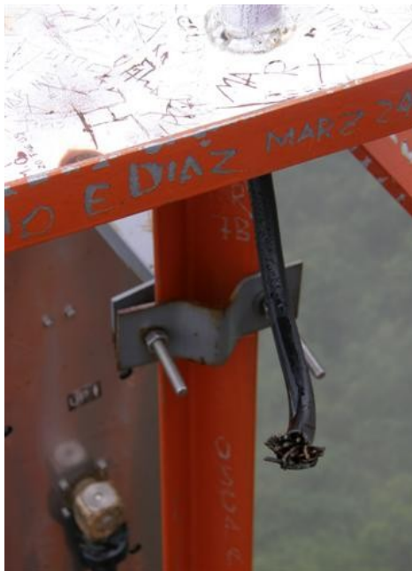
Cable tierra de torre cortado