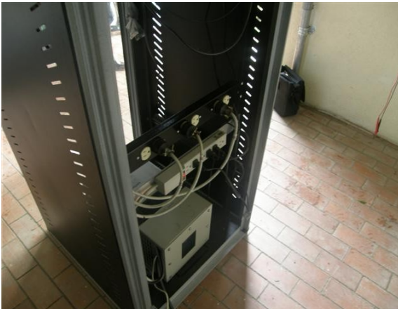
Rack de equipos