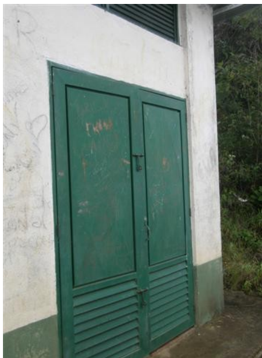
puerta de la caseta