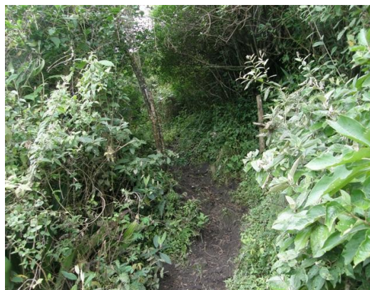
Acceso a la estación