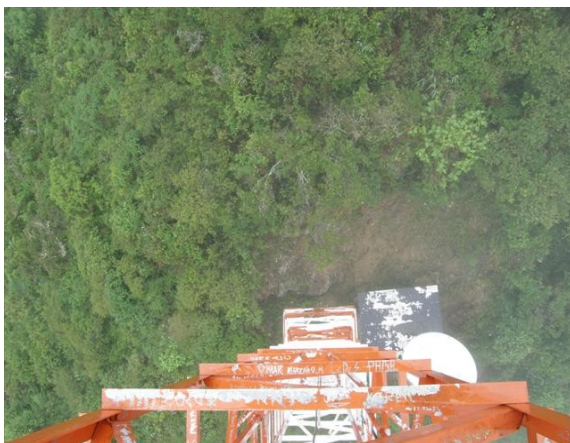
vista superior de la estación