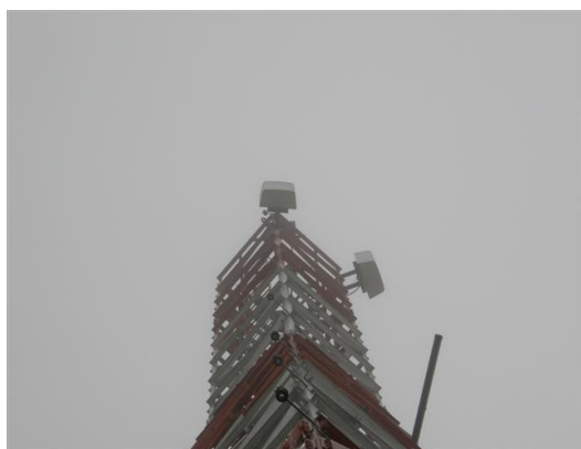
Panorámica de las antenas