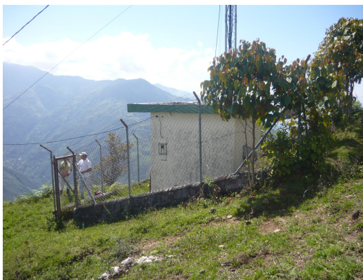
Acceso general a la estación