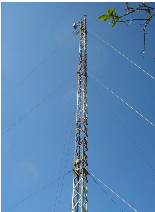
Vista general de la torre