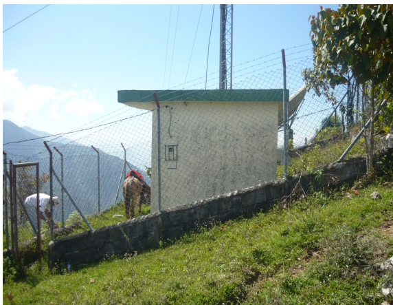
Panorámica exterior 1