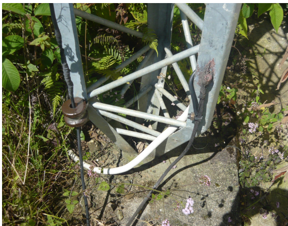
Base de la torre