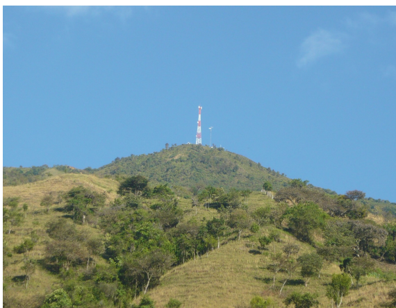
Torre cercana – Comcel 1