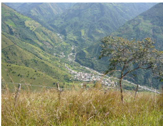
Vista panorámica 1