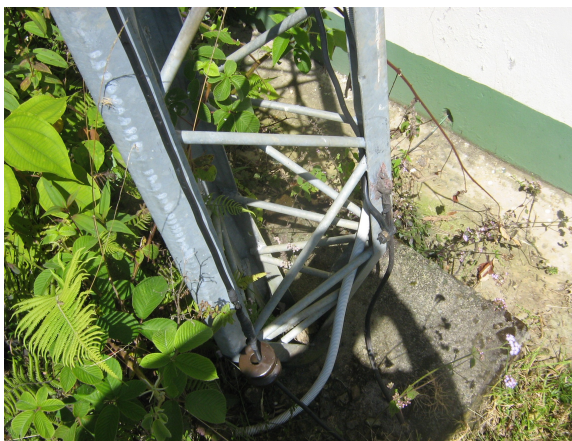
Sección de los ángulos en la base