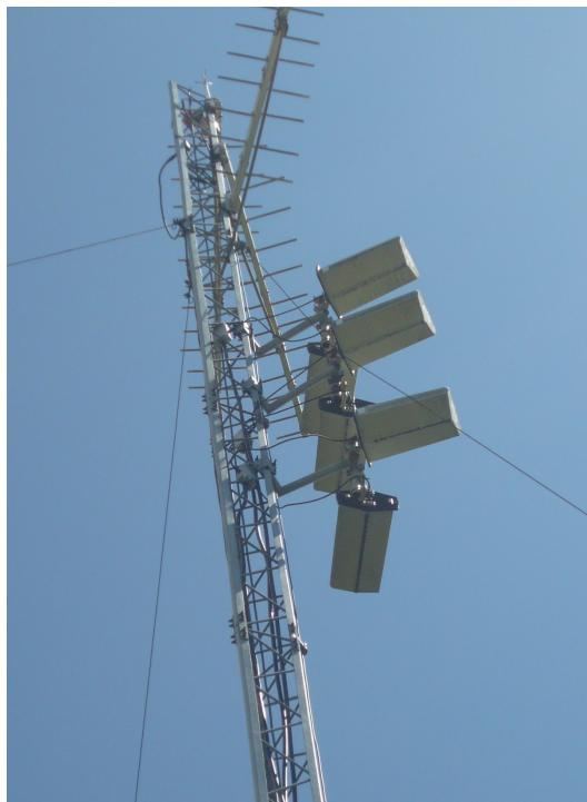
Antena - Cara C