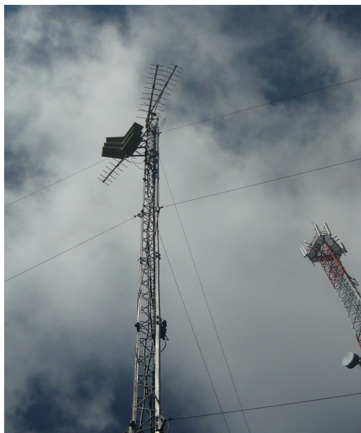
Espacio disponible para la instalación