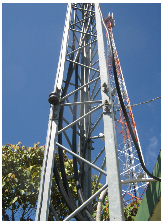
Recorrido del cable