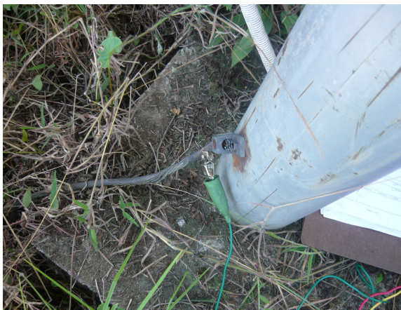
Puesta a tierra de la antena satelital