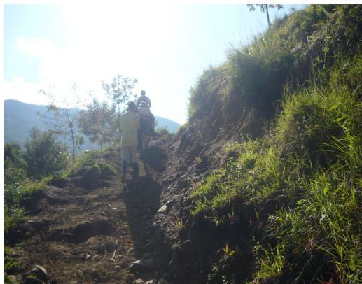
Vía de acceso