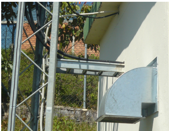
Detalle de pintura