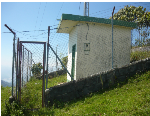
Vía de acceso