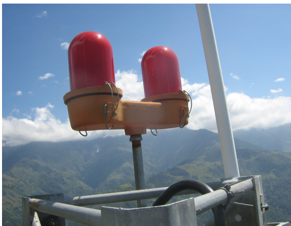
Luces de obstrucción