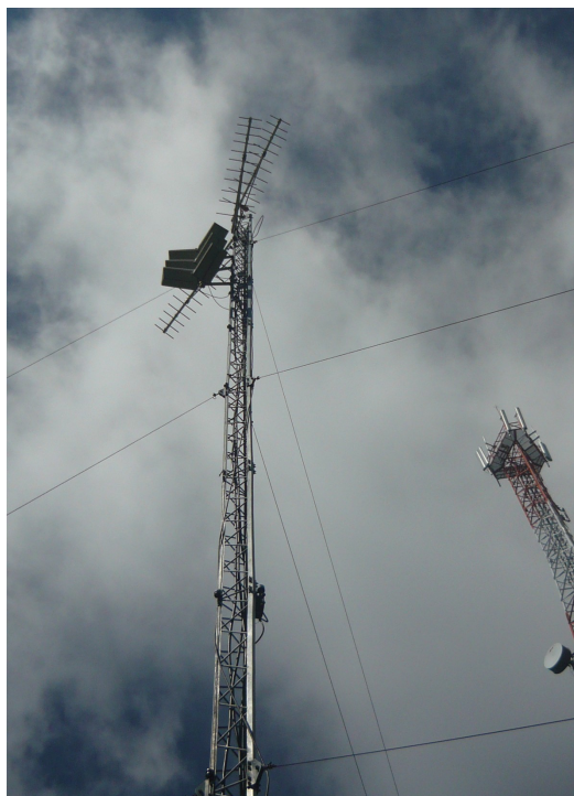
Antena - Cara B