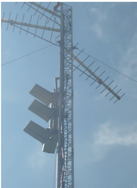
Antena - Cara A