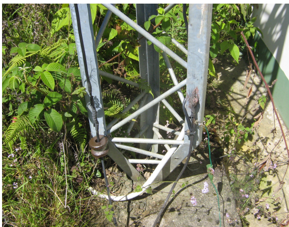
Sistema de puesta a tierra