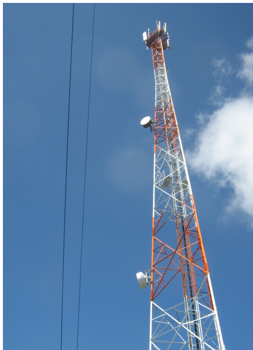
Torre cercana - Comcel