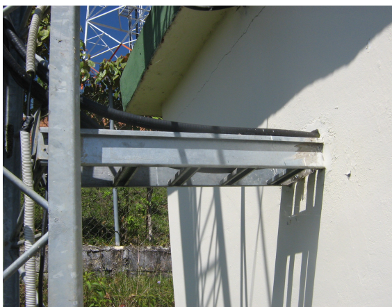
Escalerilla horizontal hacia el cuarto de equipos