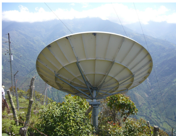
Antena satelital 1