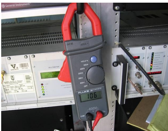
Voltaje Fase 1 - T