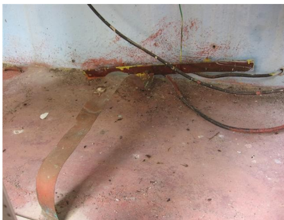
Platina tierra S. de E