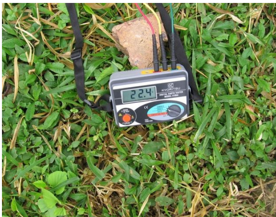
Medida tierra salón de equipos