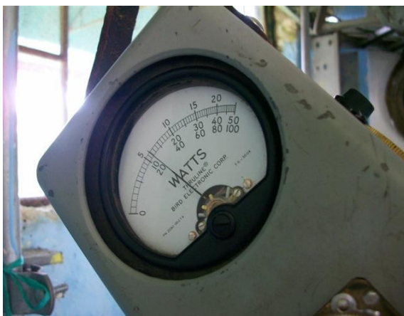
Medida potencia SI