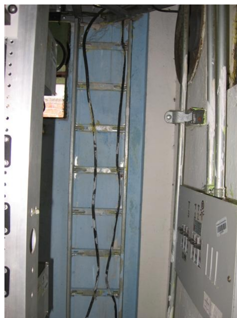
Escalerilla S. de E