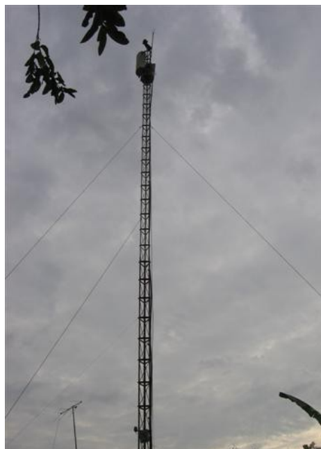
Torre cara C