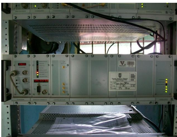
Offset S I