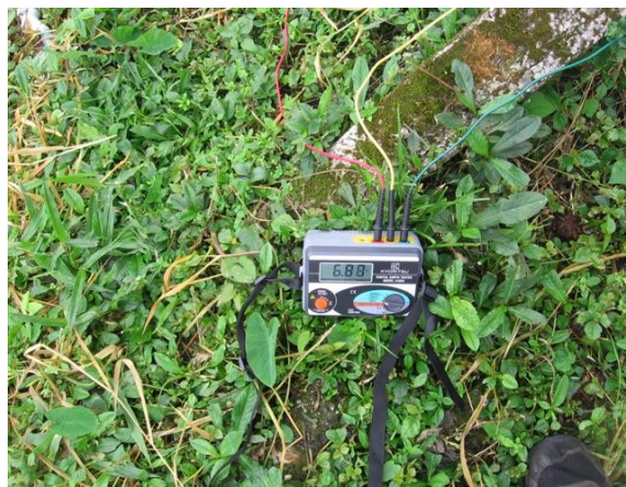
Medida tierra parábola