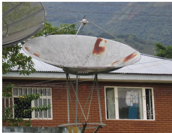
Parábola fuera de servicio