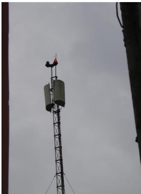
Antenas C1, SI y SC (triplexados)