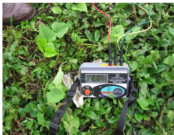
Medida tierra torre