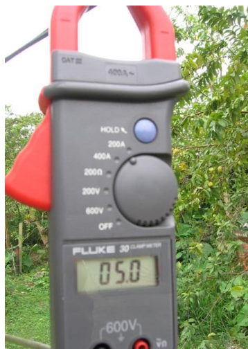
Medida cte. Fase R