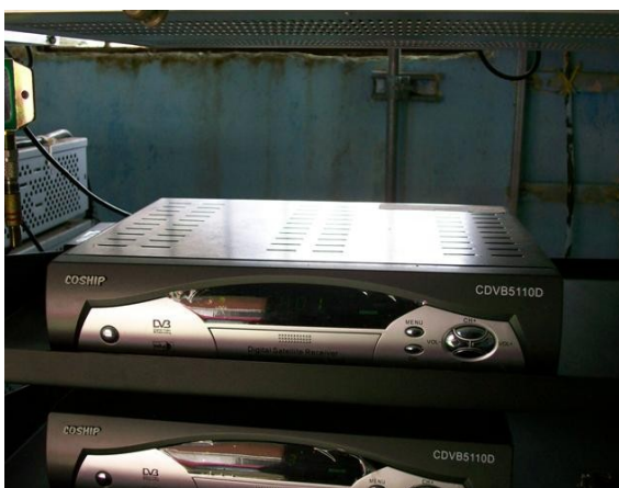
Recep. sat. C1