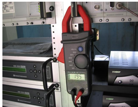
Voltaje Fase - Fase