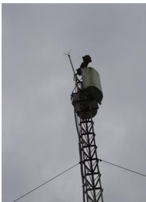
Pararrayos, luz de obstrucción y posición de las Antenas