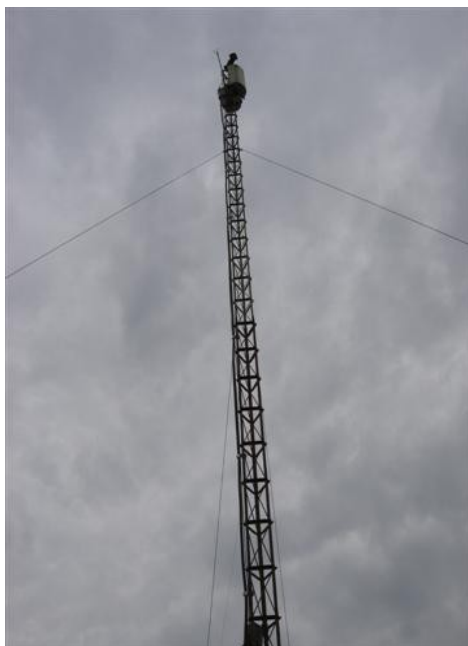
Torre cara B