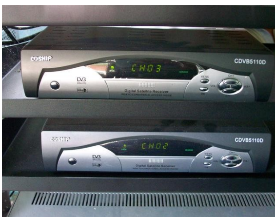
Receptores SC y S I