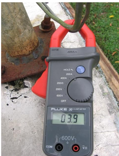
Medida cte. Fase S