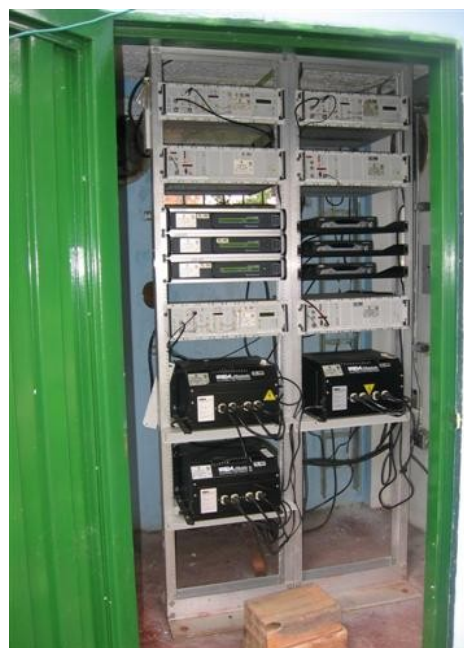
Racks de equipos