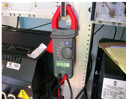
Medida Reg. C1