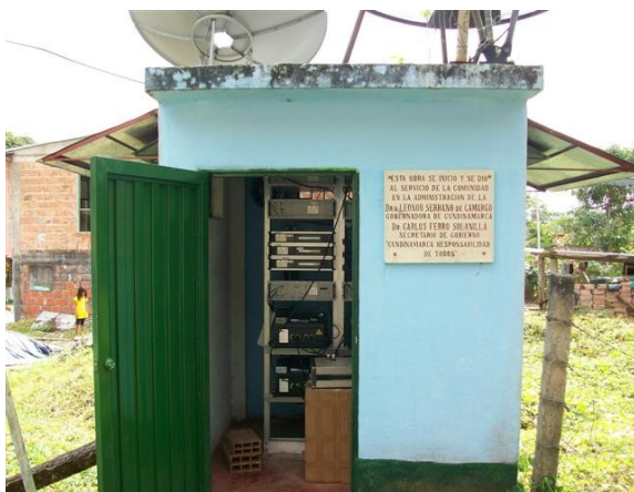
Fachada S. de Equipos