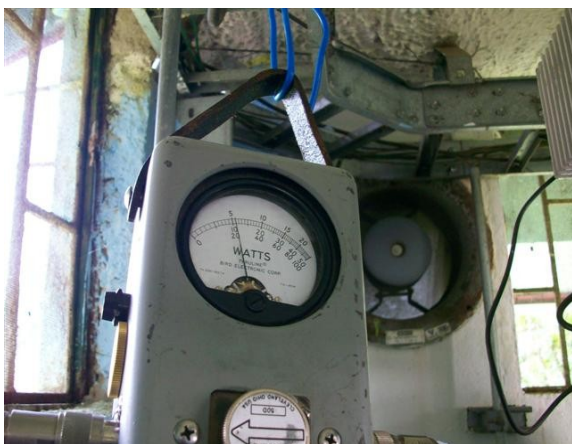
Medida potencia SC