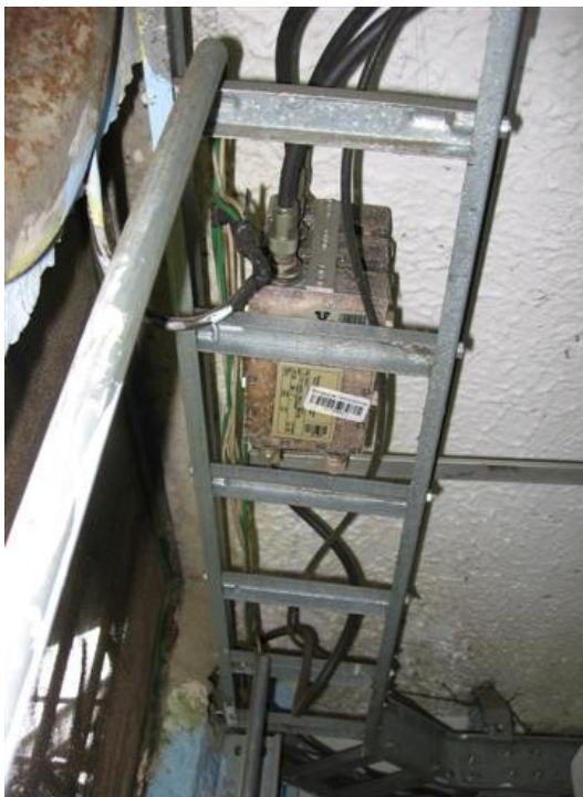
Escalerilla S. de Equipos