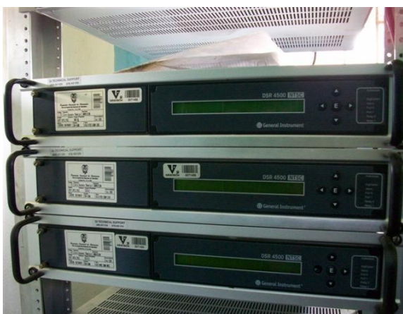
Receptores antiguos fuera de servicio