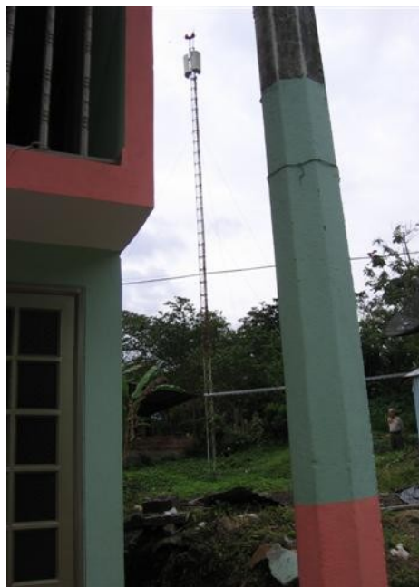
Torre cara A