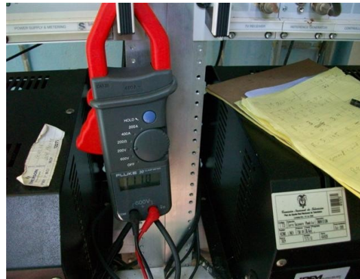
Medida Reg. S I