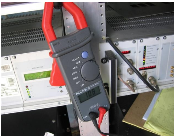
Voltaje Fase 2 - T