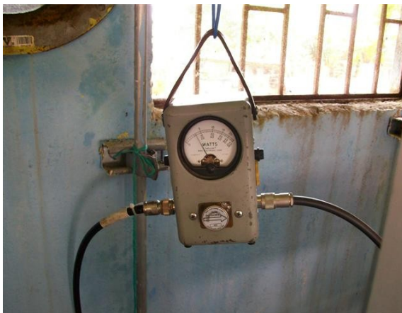
Medida potencia C1