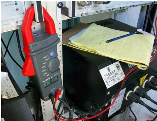
Medida reg. S C