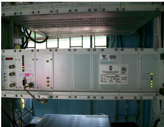
Off-set S C