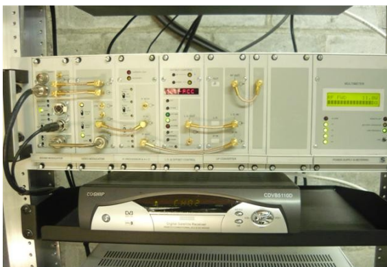
Equipo Canal Institucional