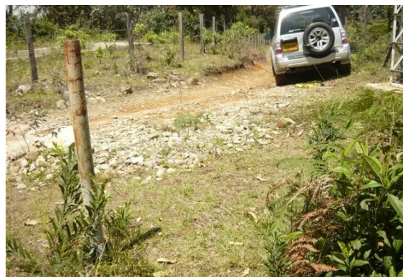
Acceso a la estación