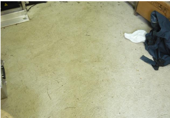
Vista del piso