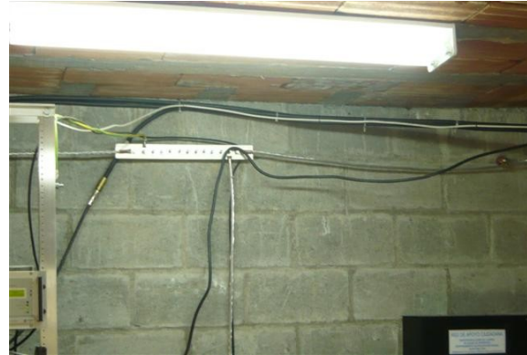
Sistema de puesta a tierra