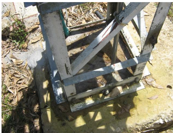
Base de la torre