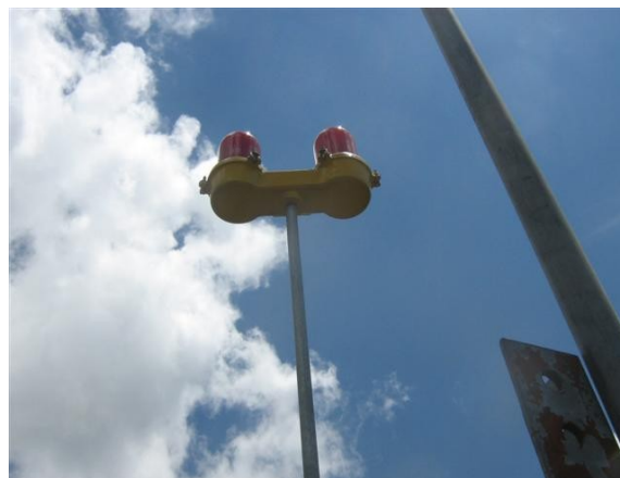
Luz de obstrucción