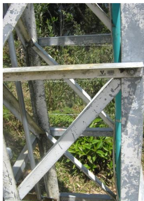
Pintura de la torre