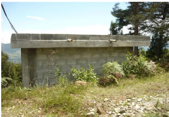
Panorámica de la estación