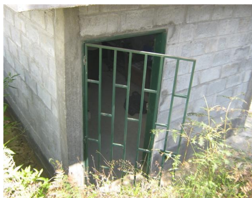
Entrada a la estación