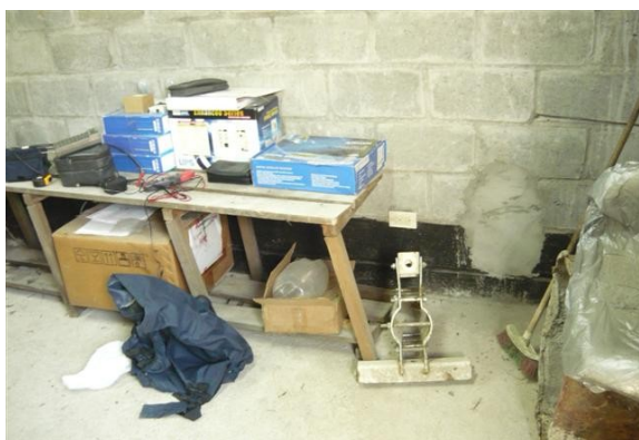
Espacio en salón de equipos