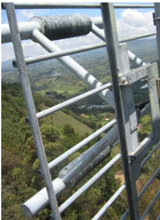
Antena thomsom V2