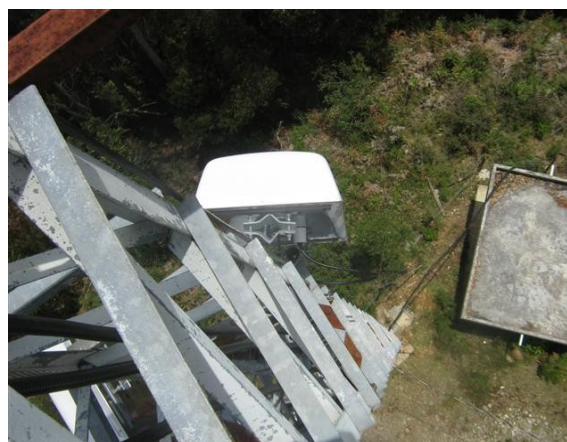
Antena panel V 3