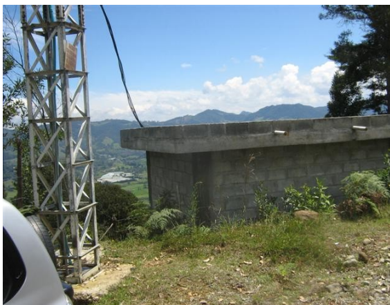
Panorámica de la estación