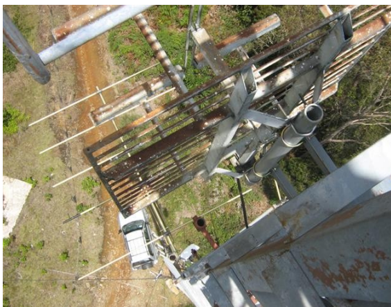
Antena thomsom V 2