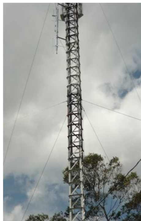
Espacio en torre