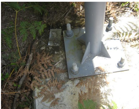
Base antena satelital