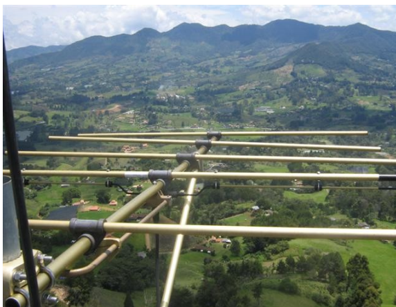
Antena yagi V 3