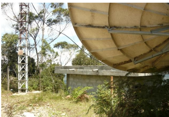
Panorámica de la estación