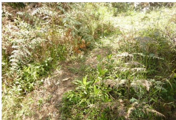
Acceso a la estación