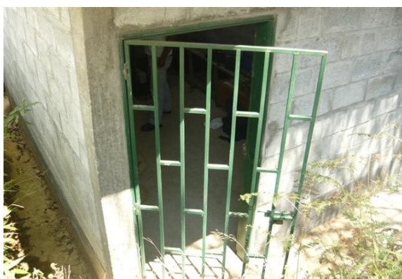
Entrada a la estación