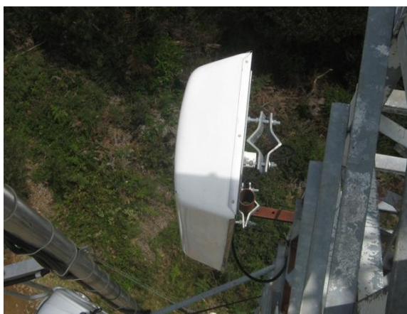
Antena panel V 2