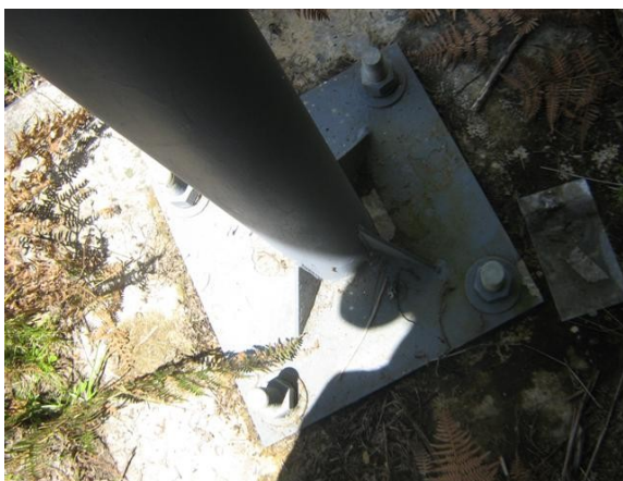
Base sin aterrizar