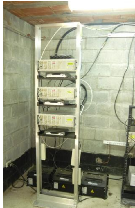
Rack de equipos