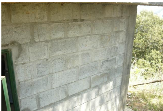
Fachada sin pintar