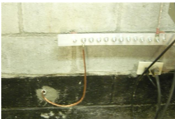
Sistema de tierra salón de equipos