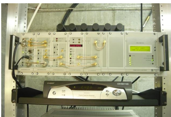
Equipos Señal Colombia