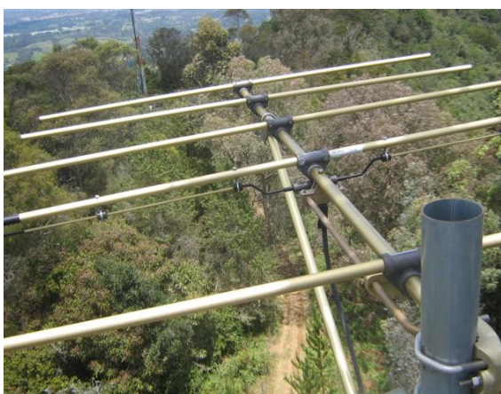
Antena yagi V 1