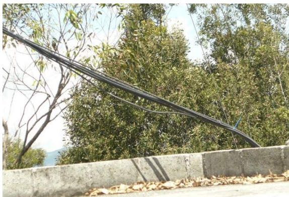
Cables al salón de equipos