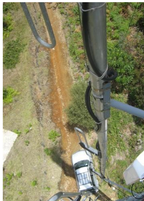
Antena omnidireccional V 2