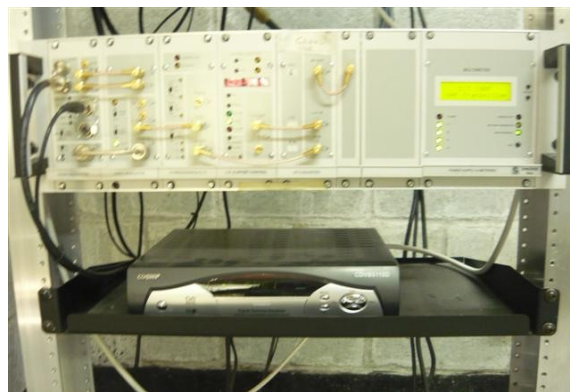
Equipos canal uno