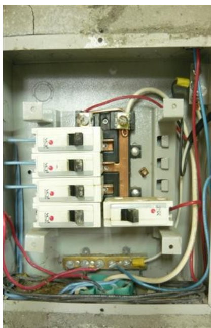
Tablero de tacos