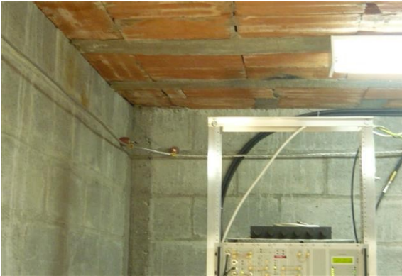
Sistema de puesta a tierra