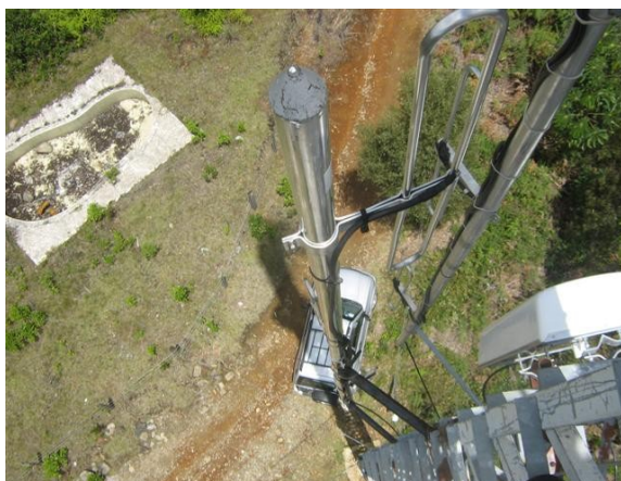
Antena omnidireccional V 1