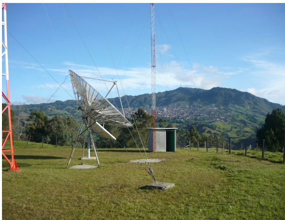
Vista Panorámica Fig.4