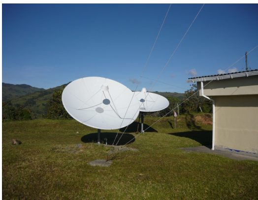
Antena Parabólica Fig.1