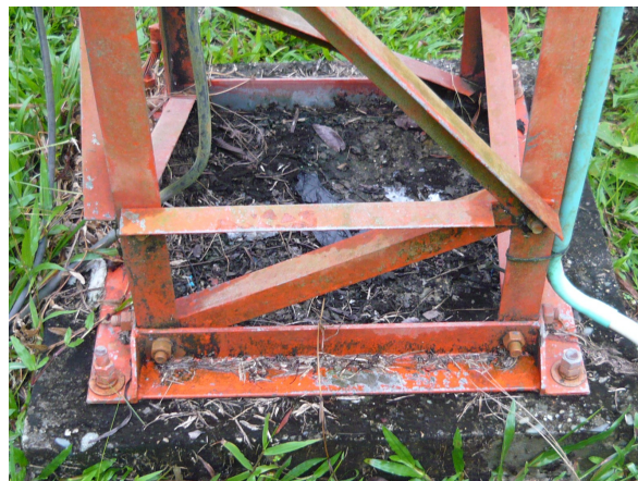
Base de la torre