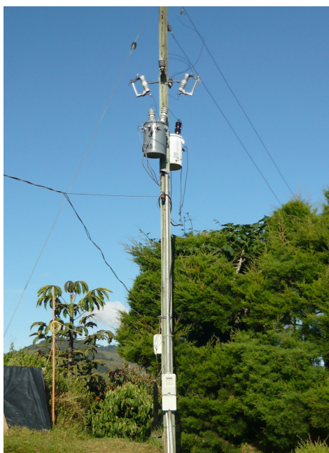
Acometida eléctrica Fig.1