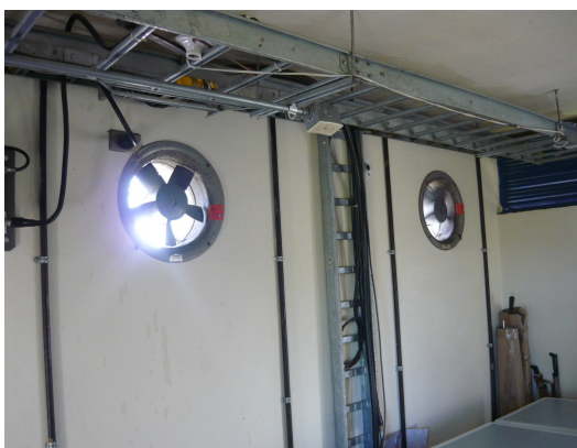
Sistema de ventilación