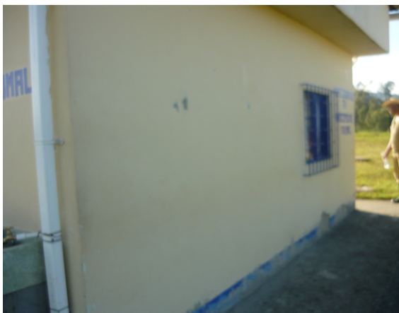
Pintura exterior Fig.1