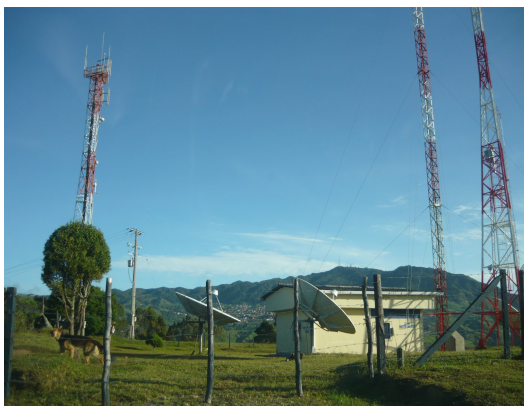
Acceso general a la estación Fig.1