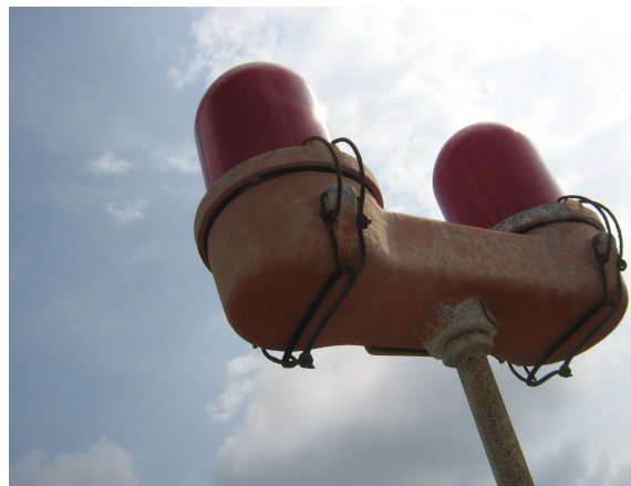
Luces de obstrucción