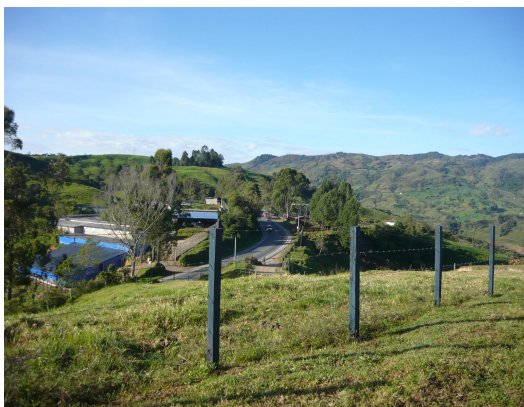
Vista Panorámica Fig.2