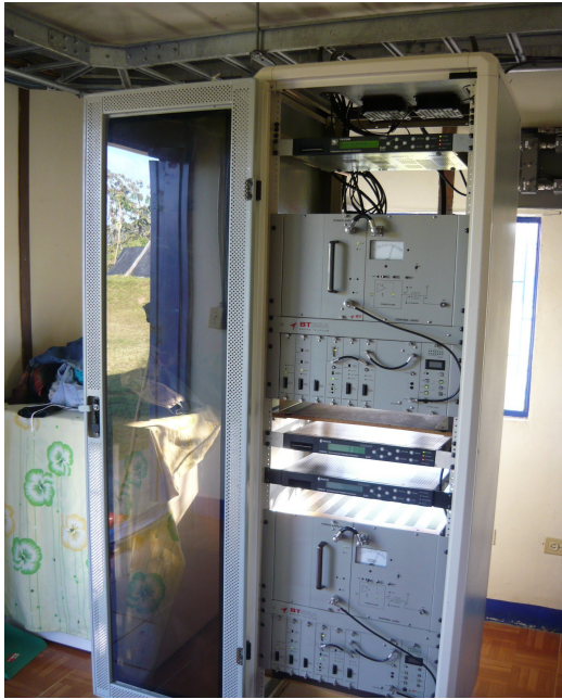
Equipos existentes Fig.2