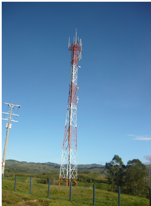
Torres cercanas Fig.1