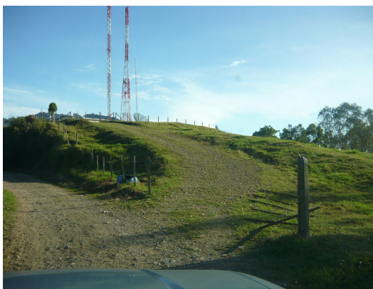
Acceso general a la estación Fig.3