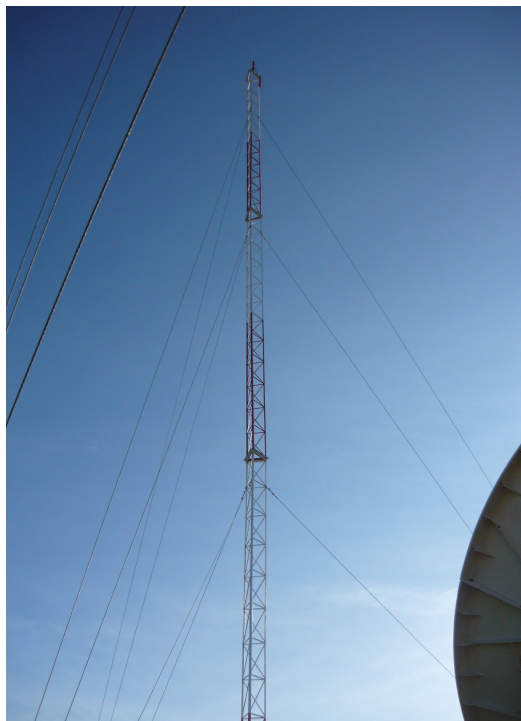
Torres cercanas Fig.2