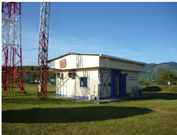
Escalerilla horizontal hacia el cuarto de equipos