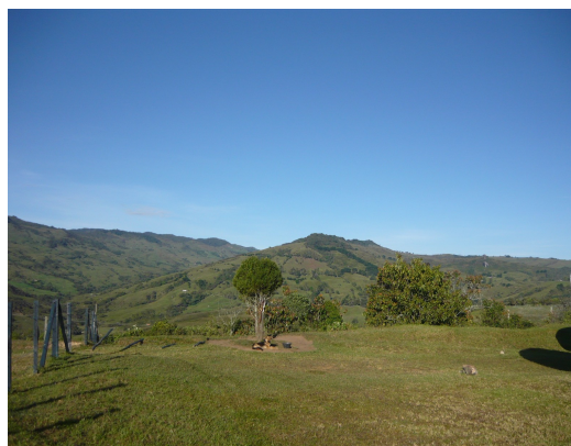
Vista Panorámica Fig.1