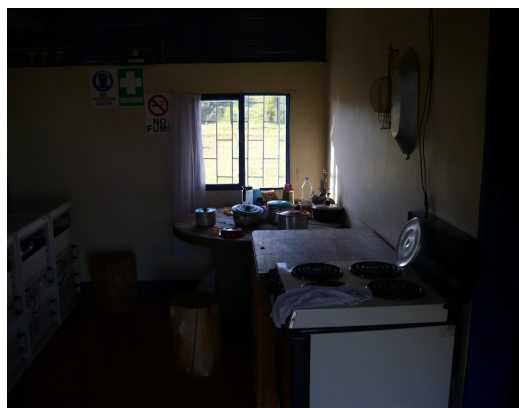
Espacio para nuevos equipos.