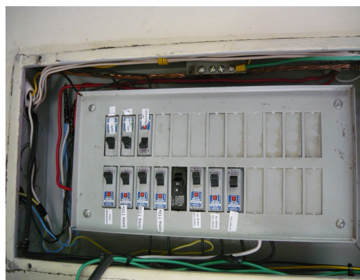
Caja de breakers