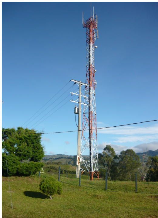
Torres cercanas Fig.3