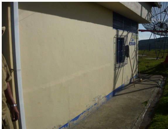
Pintura exterior Fig.2