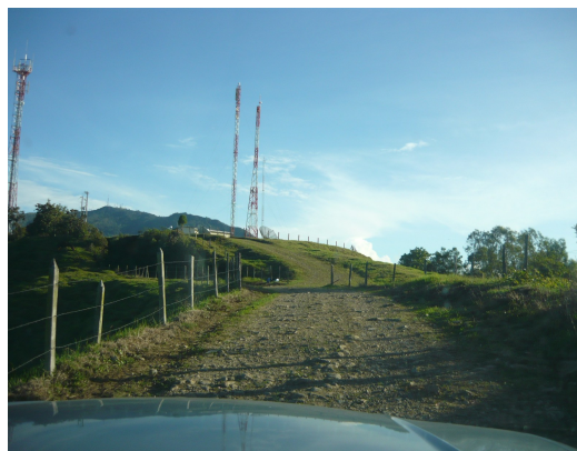
Acceso general a la estación Fig.2