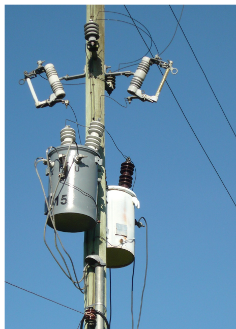
Acometida eléctrica Fig.2