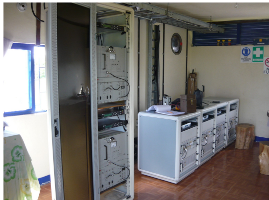
Vista panorámica interior