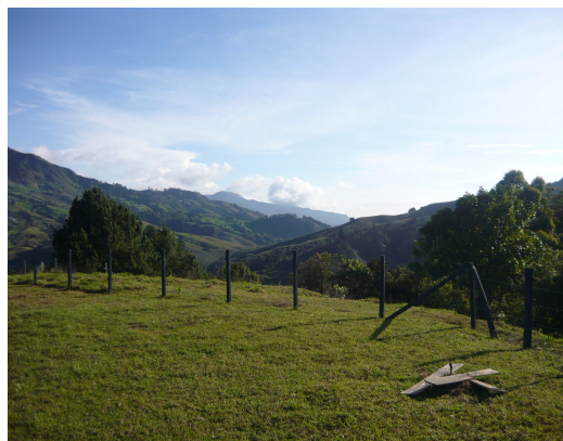
Vista Panorámica Fig.3