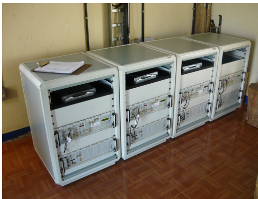
Equipos existentes Fig.1