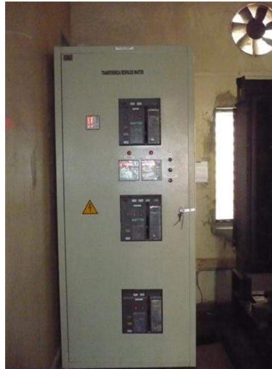
Transferencia Auto Master