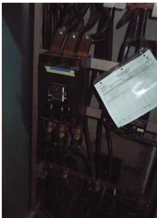
Totalizador N° 2