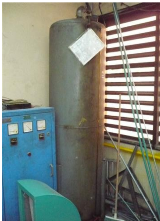
Tanque Planta Servicios Generales