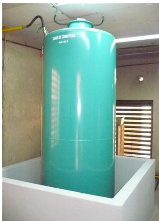
Tanque Planta Master de Emisión