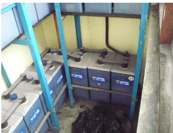
Banco de Baterías uW