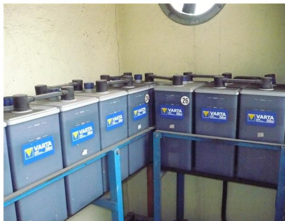
Banco de Baterías uW