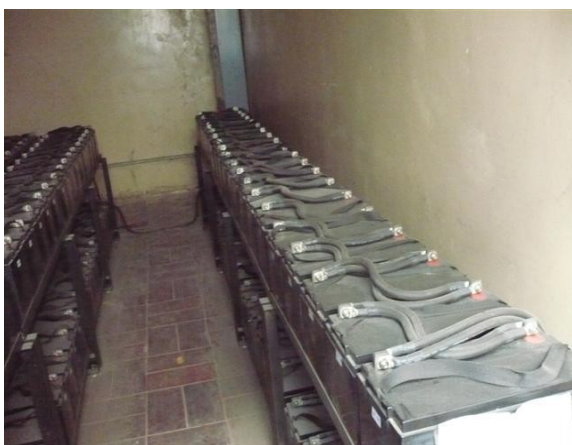
Banco de Baterías UPS