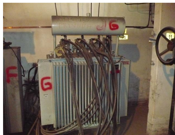
Transformador N° 2 300kVA