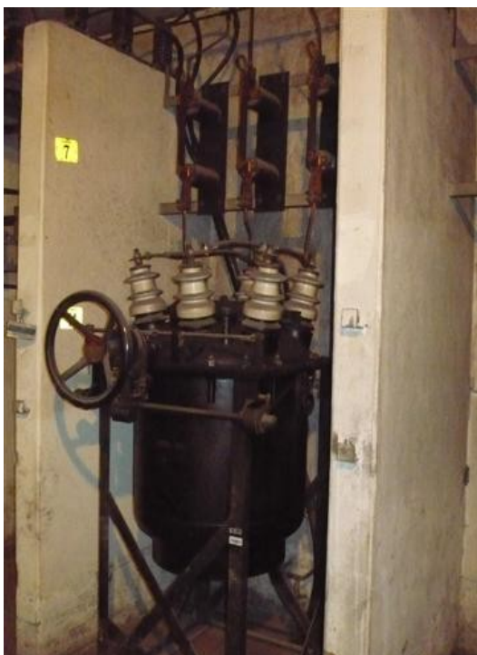
Transferencia Media Tensión 2