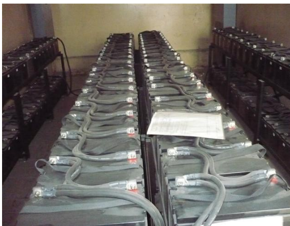
Banco de Baterías UPS