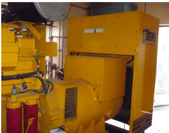
Planta Back Up Master