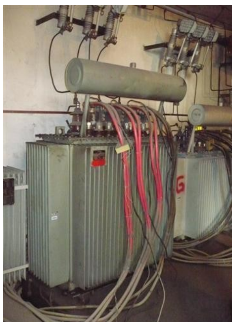
Transformador N° 3 450kVA