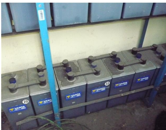
Banco de Baterías uW