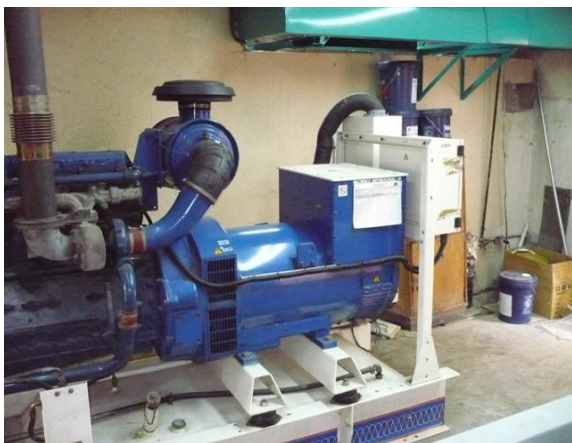
Planta Servicios Generales