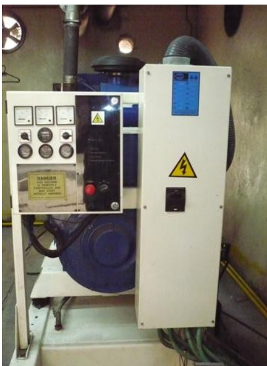
Planta Servicios Generales