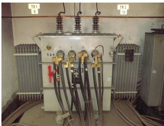
Transformador N° 1 500kVA