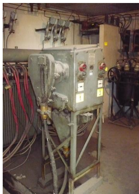
Transferencia Media Tensión 1