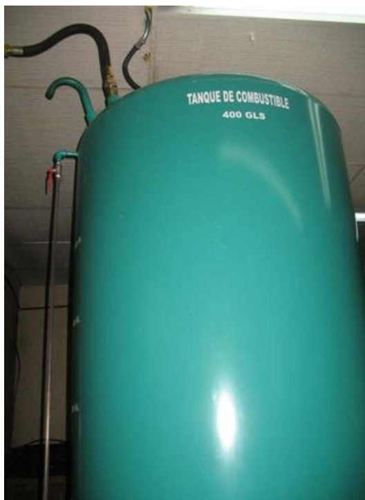
Tanque Planta Master de Emisión