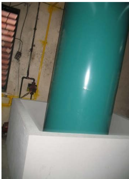
Tanque Planta Master de Emisión