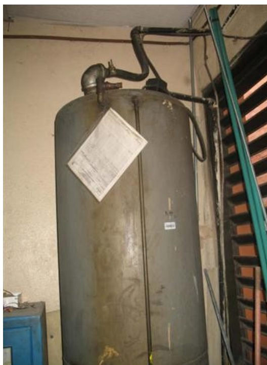
Tanque Planta Servicios Generales