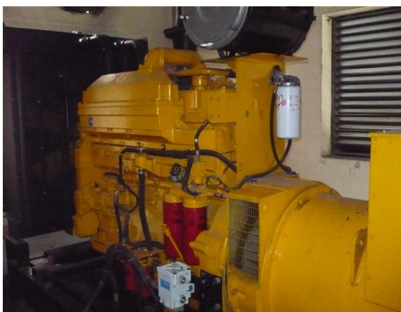
Planta Back Up Master