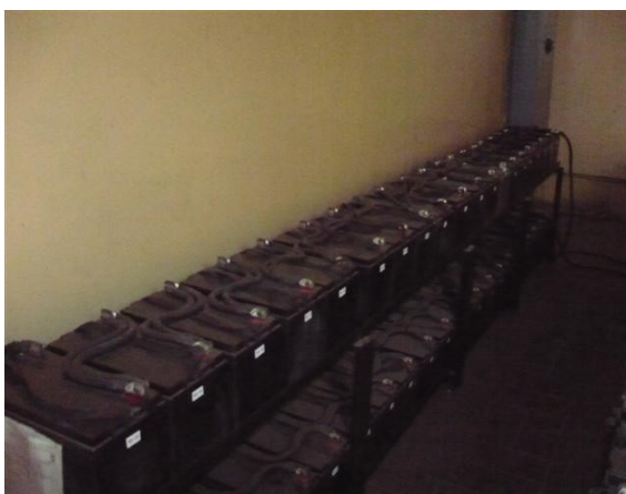
Banco de Baterías UPS