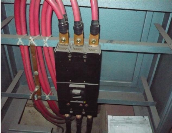
Totalizador N° 3