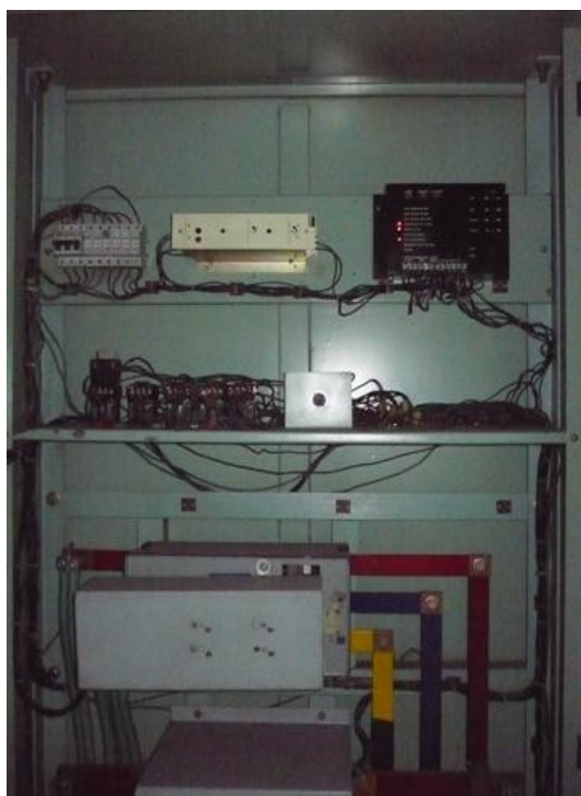
Totalizador N° 1