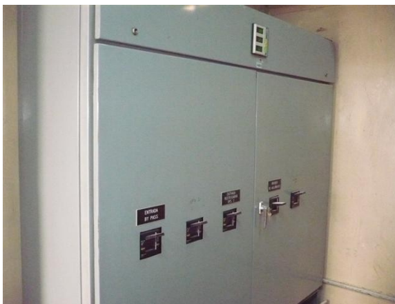
Bypass de Mantenimiento UPS