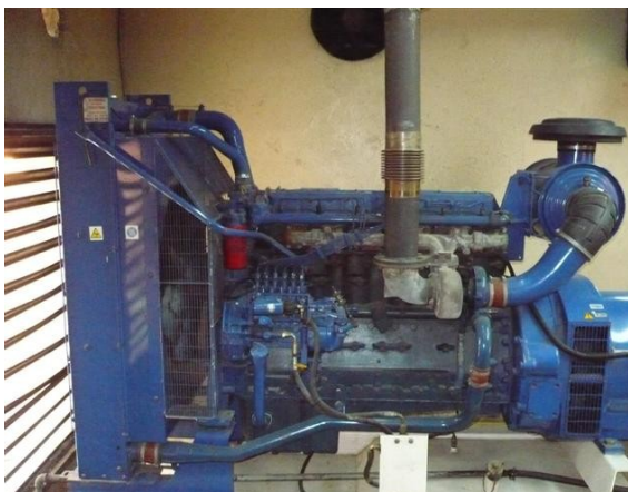
Planta Servicios Generales